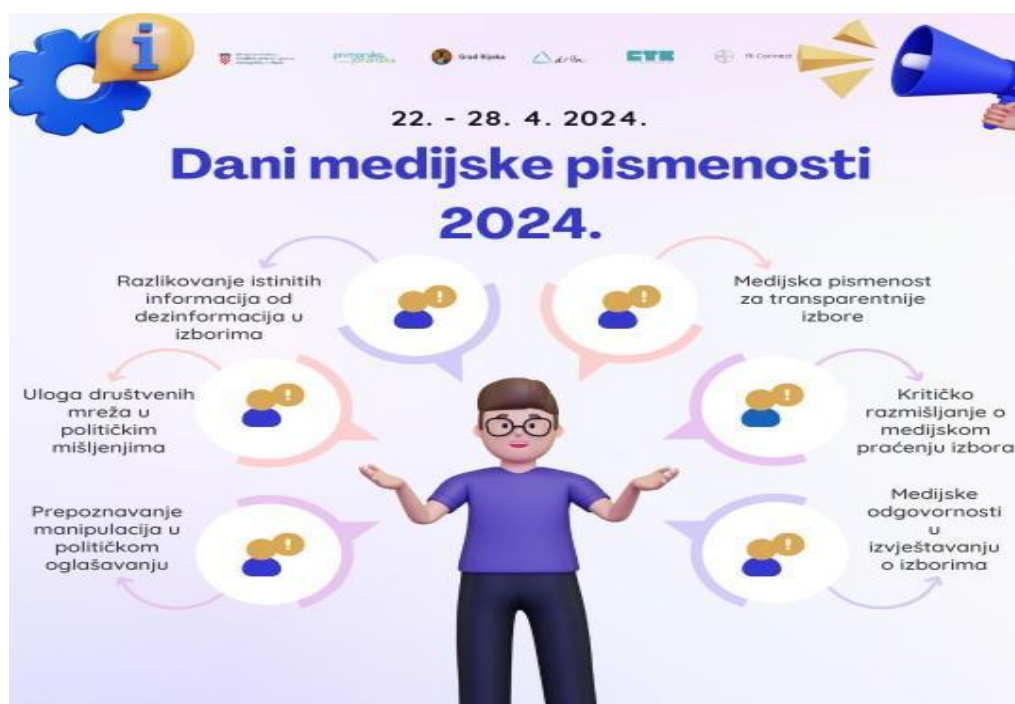
Slika 3.3. Prikaz Dana medijske pismenosti 2024.