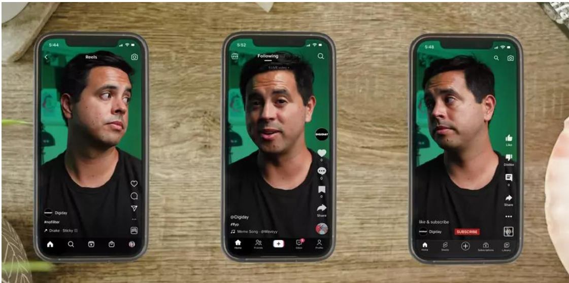
Slika 4. Prikaz Reelsa, Shorts-a i TikToka