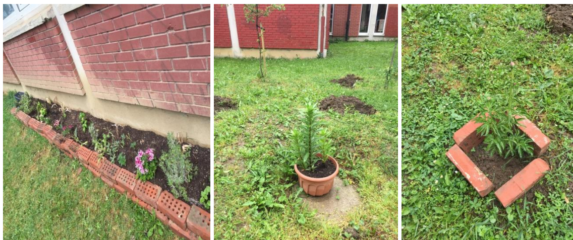
Slika 20. Školski vrt u međuprostoru Osnovne škole Eugena Kumičića

Od cvijeća imaju nešto trajnica, ali i nešto sezonskog cvijeća kao što su maćuhice i tulipani. Nedavno su posadili i začine od kojih se dio nalazi vani u visokoj gredici, a dio unutar škole (lavanda, ružmarin, smilje, metvica, timjan i melisa).