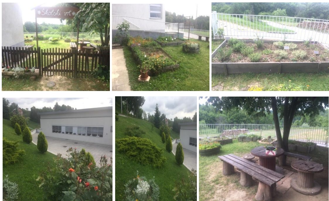
Slika 25. Školski vrt Osnovne škole Slavka Kolara, Kravarsko