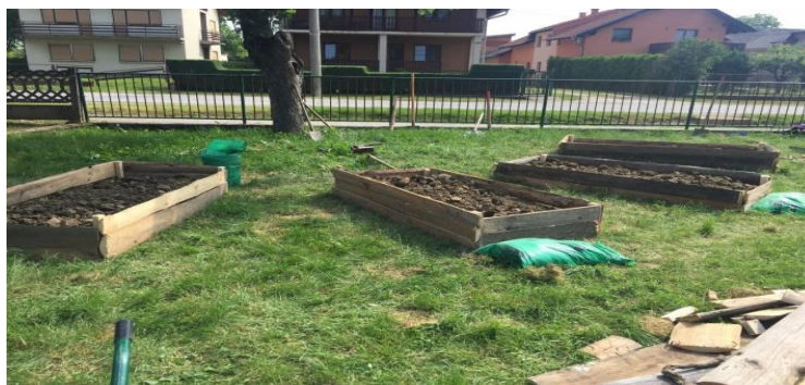
Slika 11. Visoke gredice ispred Područne škole Rakitovec

Područna škola Rakitovec ove je godine odlučila proširiti školski vrt. Intervju je obavljen s učiteljicom Tatjanom Mikulin i prisustvovalo se izgradnji visokih gredica. Učiteljica Mikulin navodi kako su prije šest godina imali mali prizemni školski vrt koji je prilikom ljeta znao propasti i bio je pokošen od strane domara, stoga su se sada odlučili na visoke gredice oko čije su se izrade uključili očevi učenika. Daske za gredice bile su donacija učitelja Grahovca, a ostali materijal, kao što su sjemenke i mrežice, kupili su novčanim sredstvima koja su zaradili skupljanjem starog papira, starih čepova i baterija. Učenici su vrlo angažirani, vole boraviti u prirodi i pomagati oko uzgoja svih vrsta biljki. Plan je da svaki razred ima svoju gredicu o kojoj će brinuti, a o cvijeću i začинима će brinuti zajednički. U gredice planiraju posaditi već pripremljene sadnice rajčice, paprike, zelja, mrkve, luka i salate. Cilj je da djeca vide razliku između korjenastog, zeljastog i plodovitog bilja.