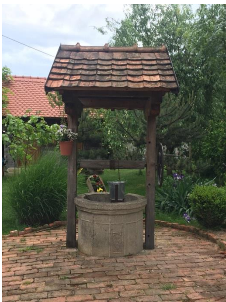
Slika 29. Starinski bunar Snimila: Helena Domjanković, 2018.

Nakon razgledavanja slijedi ručak. Potom učenici odlaze pješice do jezera Ježevo. Usput prolaze uz nekadašnji bunar.