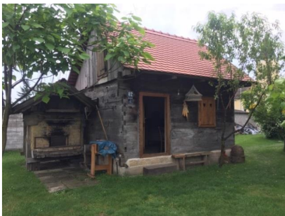
Slika 24. „Hiža“ prizemnica i krušna peć pored nje

Prva skupina učenika odlazi s vodičem u obilazak unutrašnjosti Etno kuća i razgledavanje zavičajne turopoljske zbirke. Heurističkim razgovorom, vodič potiče učenike na otkrivanje različitih predmeta (neki učenici znaju nazive ako imaju stariju baku ili djeda koji su im nekad o tome pričali ili im pokazali). Razgledavanjem turopoljske „hiže“ prizemnice učenici iznose svoja razmišljanja o nekadašnjem životu. Zašto se ova kuća zove prizemnica? Što je ovo uz kuću? (Krušna peć.) Kako se nekad živjelo? Je li bilo teže ili lakše nego danas? (Teže.) Zašto?