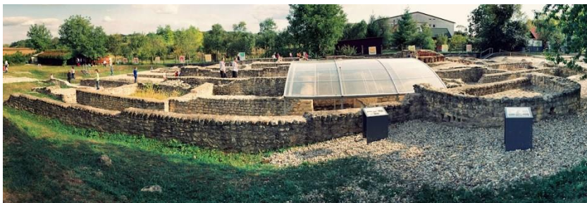
Slika 7. Ostaci rimskog grada, Šćitarjevo

Proljeće u Andautoniji poznatije kao Dani Andaunije je manifestacija koja se održava zadnji vikend u travnju. Posjetitelji se mogu upoznati s rimskom tradicijom i sudjelovati u brojnim radionicama (odjevanje u rimsku odjeću, kušanje rimske hrane, rimske igre). (Turistička zajednica grada Velike Gorice, Kulturna baština Turopolja , 2009).