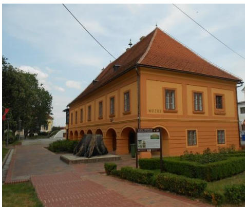
Slika 2. Muzej Turopolja

Posjetom muzeju saznaje se čime su se bavili Turopoljci, kako su se odijevali i kako su im bile uređene kuće.