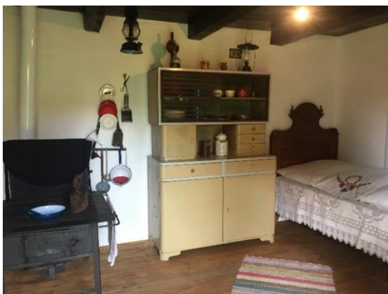
Slika 25. Unutrašnjost „hiže“ prizemnice Snimila: Helena Domjanković, 2018.

Kako izgleda serviran stol za jelo? Jeste li prije vidjeli ovakve zdjelice? Što nedostaje ovoj kući? (Sudoper.) Pa kako su oni došli do vode? (Pumpom, bunarom...)