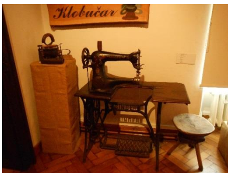
Slika 18. Pribor za zanat klobučara ili šeširdije Snimila: Helena Domjanković, 2018.