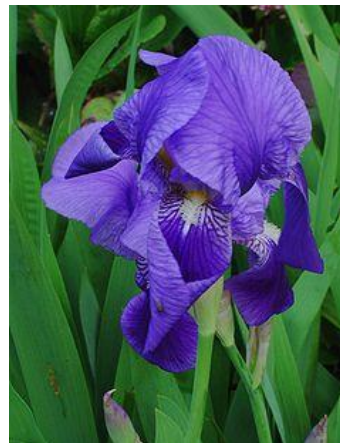
PERUNIKA (može biti i žuta)

Fotografiraj još neku biljku koja ti se činila zanimljivom.