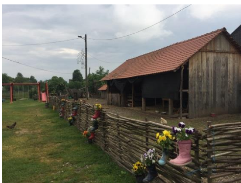
Slika 26. Staja sa životinjama Snimila: Helena Domjanković, 2018.

Dok 1. skupina razgledava „hižu“ prizemnicu, druga skupina se upoznaje s alatom koji se koristio u prošlosti za obradu zemlje (plugovi, drljače, sijačice...) Nakon toga odlaze u kuhinju gdje se nalazi velika krušna peć. Učenicima se prikazuje prezentacija izrade kruha – upoznavanje s mlinom i originalnom krušnom peći. Nakon prezentacije učenici promatraju kako se mijesi i oblikuje kruh, a onda imaju i sami priliku iskušati se u tome. Učenici mijese i oblikuju mali kruščić s izgledom po želji, a nakon toga ga stavljaju u krušnu peć na pečenje. Kada je kruščić pečen, učenici ga prigodno pakiraju i spremaju u torbu. Ova skupina odlazi u razgled životinja. Od životinja naselje ima patke, kokoši, ovde, svinje i zečeve.