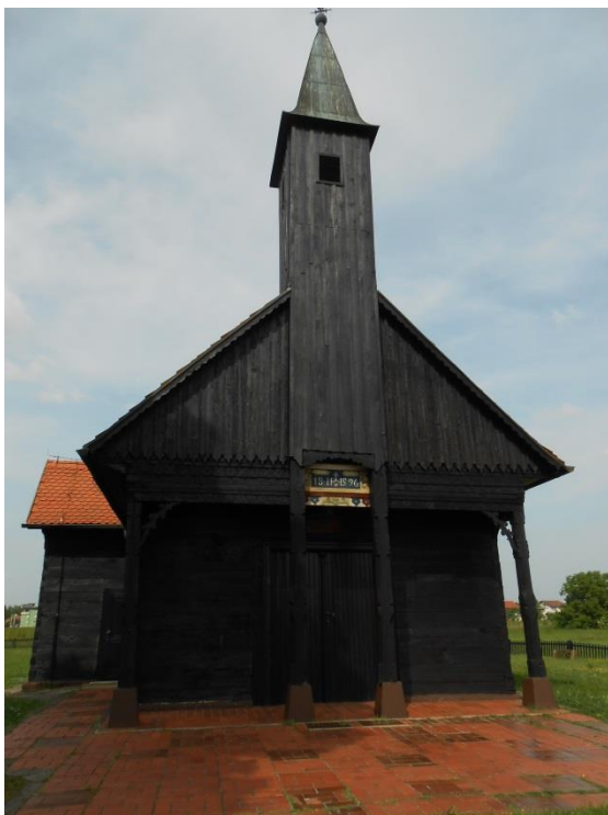
Slika 12. Kapela Ranjenog Isusa Snimila: Helena Domjanković, 2018.

„Građena je od hrastovih planjki sa zanimljivo riješenim pročeljem. Blago isturen toranj – zvonik oslanja se na dva stupa trijema i uzdiže visoko nad krovom. Stupovi trijema su izrezbareni, a krajevi dasaka koje zatvaraju zabat ispiljene su u obliku kišnih kapi“ (Matković Mikulčić, 2010, str. 84).