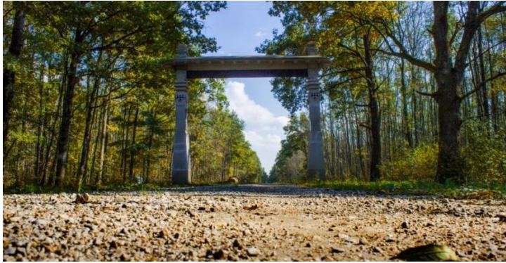
Slika 10. Vrata od krča