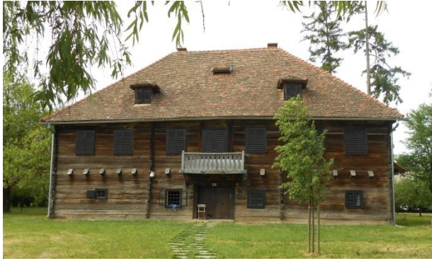
Slika 8. Kurija Modić – Bedeković u Donjoj Lomnici Snimila: Helena Domjanković, 2018.