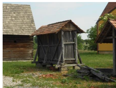
Slika 23. Stari kukuružnjak Snimila: Helena Domjanković, 2018.