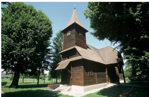
Slika 11. Kapela Sv. Barbare

Kapela Sv. Barbare nalazi se u Velikoj Mlaci. Najatraktivniji je primjerak drvene sakralne kapele baroknog razdoblja. Maroević (1997) iznosi da kapela Sv. Barbare omogućuje sustavno praćenje dviju faza gradnje do današnjeg izgleda koji je dobiven u poslijebaroknom razdoblju. Na „pristašku“ 8 su urezane brojke 1642. (gradnja kapele) i 1912. (dogradnja trijema). Urezana je i 270 godišnja tradicija turopoljskog tesanja i gradnje u drvu (Maroević, 1997).