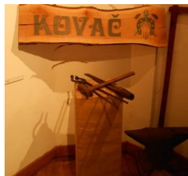
Slika 19. Pribor za zanat kovača Snimila: Helena Domjanković, 2018.