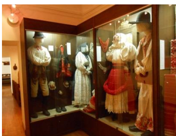
Slika 3. Tradicijske turopoljske nošnje