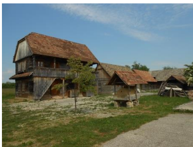
Slika 21. Stari čardaci Snimila: Helena Domjanković, 2018.

U razgovoru se saznalo da će u budućnosti biti moguć posjet u Buševac gdje se sakupljaju stari čardaci i planira se otvoriti Etno selo. Posjetivši to mjesto dobile su se informacije kako je to moguće očekivati već u 6. mjesecu 2018. godine jer se intenzivno radi na preuređenju i obnavljanju sjaja starim čardacima. Za vrijeme posjeta, skupili su se ljudi iz Buševca, podijelili zadatke i uređivali prostorije. U prostorijama se nalaze vrijedni predmeti koji još trebaju pronaći svoje mjesto u ovim prostorijama.