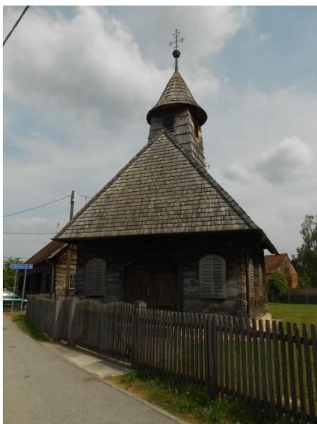
Slika 13. Kapela sv. Ivana Krstitelja 2018.