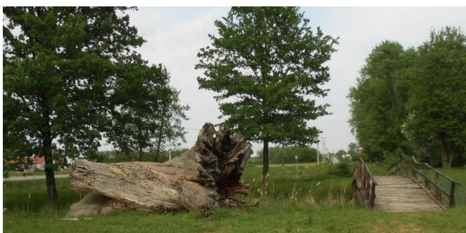
Slika 6. Hrastov panj ispred grada Lukavca