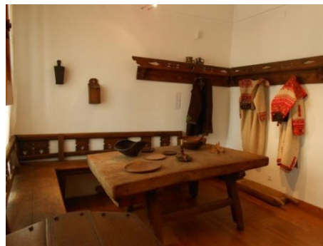
Slika 17. Serviran stol Snimila: Helena Domjanković, 2018.