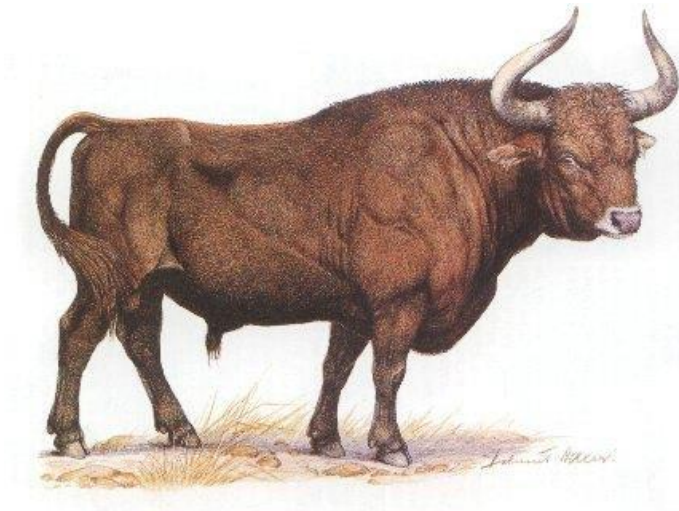
Slika 1. Govedo tur

Turopolje se sve do 16. stoljeća naziva Zagrebačko polje ( Campus Zagrabiensis ). (Matković Mikulčić, Bukovec, 1999).