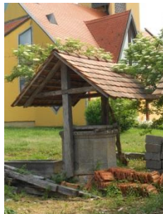
Slika 22. Bunar 2018.