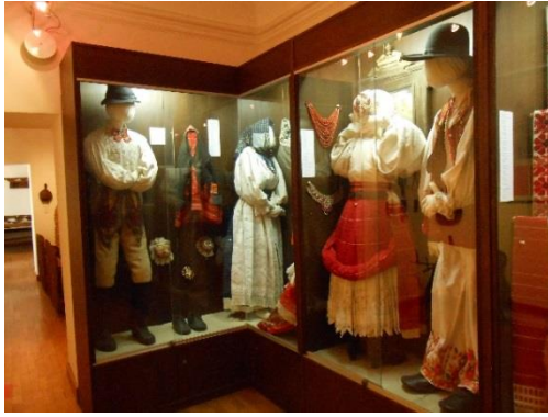
Slika 15. Narodne nošnje i ukrasi

Šetajući dalje muzejom, dolazi se do predmeta koji su Turopoljcima služili pri izradi platna. Tu se nalazi tkalački stan pored kojeg je nalazi pismeni opis obrade lana i konoplje kako bi se dobilo platno. Uz to su izloženi i predmeti koje su koristili pri svakom koraku obrade lana ili konoplje. Prolazeći uz još nekoliko starih, ali očuvanih predmeta dolazi se do serviranog stola za jelo, baš onako kako je to bilo nekada. Nadalje se mogu vidjeti strojevi i alati koji su Turopoljcima služili za različite zanate. Neki od zanata su klobučar ili šeširdija i kovač.