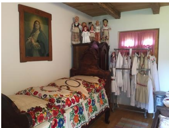
Slika 27. Narodne nošnje i starinski predmeti Snimila: Helena Domjanković, 2018.

Dok je 2. skupina u razgledu životinja, prva skupina dolazi mijesiti kruščić. Kada su obje skupine gotove, idu u razgled kuće u kojoj se nalaze različiti starinski predmeti iz prošlosti.