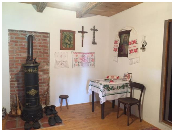
Slika 28. Mali dnevni boravak s tradicijskim detaljima Snimila: Helena Domjanković, 2018.

Nakon razgledavanja slijedi ručak. Potom učenici odlaze pješice do jezera Ježevo. Usput prolaze uz nekadašnji bunar.