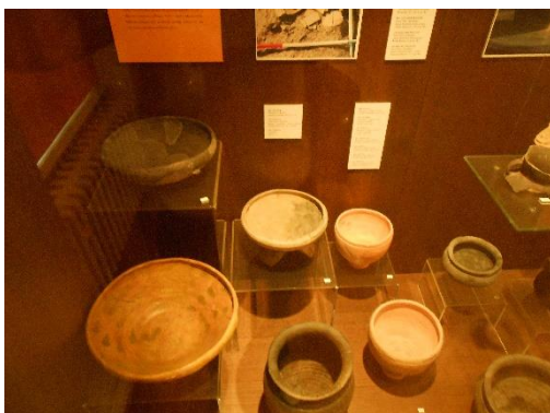
Slika 20. Keramičke posude

Pred kraj muzeja izloženi su metalni predmeti, oružje, oruđe i keramičke posude.