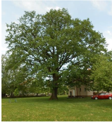
Slika 14. Hrast u Rakitovcu