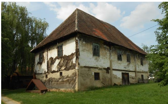
Slika 9. Kurija Alapić u Vukovini