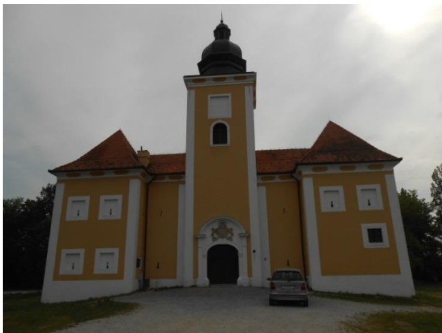
Slika 5. Grad Lukavec Snimila: Helena Domjanković, 2018.

Stari grad Lukavec otvoren je za posjetitelje uz prethodnu najavu. Učenici koji pohađaju škole u Turopolju i okolici, redovito ga posjećuju.