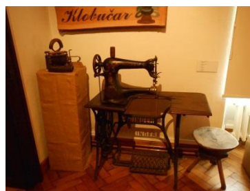
Slika 4. Stroj za šivanje