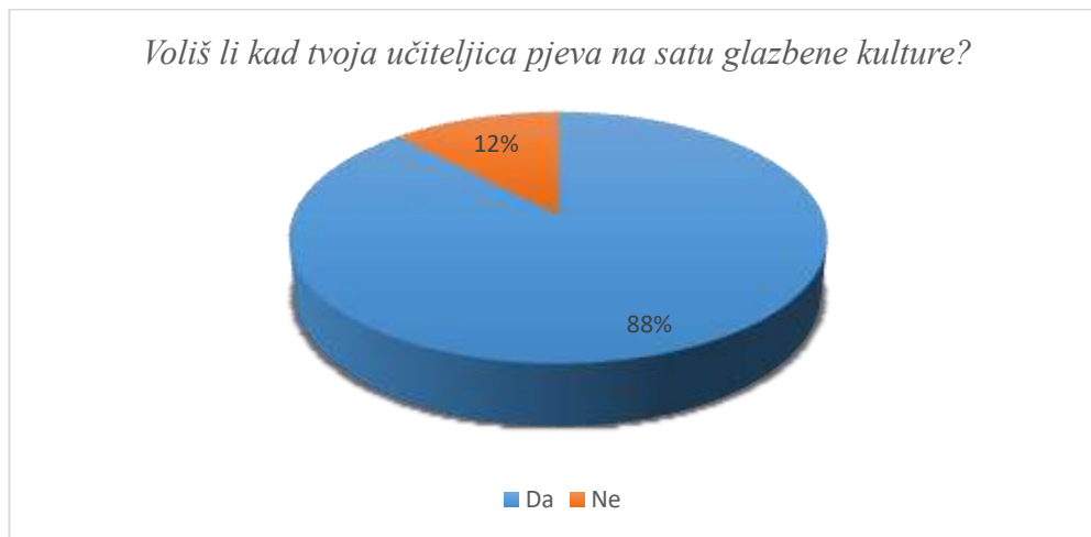
Slika 4. Osjećaji prema pjevanju učitelja u nastavi glazbene kulture

Učenici u većinskom broju uživaju kad su njihovi učitelji, u ovom slučaju učiteljice, također aktivni u nastavi pa stoga 88% ispitanika voli kada učiteljica pjeva na satu glazbene kulture, a 12% učenika tu aktivnost ipak ne voli. U prva tri razreda učenici u gotovo maksimalnom postotku izražavaju ljubav prema učiteljičinom pjevanju, dok u četvrtom razredu, kada (kao što je već spomenuto) ljubav prema nastavi glazbene kulture opada, čak 41% ispitanika odgovara na ovo pitanje negativno.