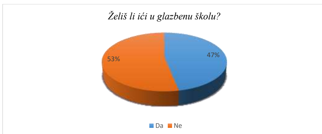
Slika 10. Želja za pohađanjem glazbene škole

U željama za pohađanjem glazbene škole postotci su gotovo izjednačeni. 47% ispitanika koji ne pohađaju glazbenu školu izrazilo je želju za pohađanjem, a 53% to ne bi htjelo.