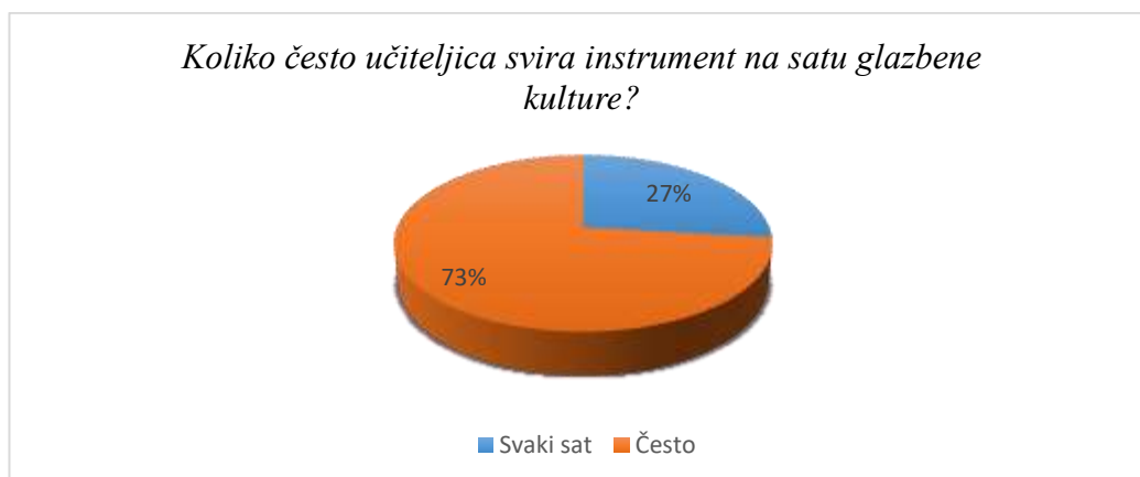
Slika 5. Učestalost učiteljevog sviranja instrumenta na satu glazbene kulture

Ispitanici ni u ovom pitanju nisu sakrili oduševljenje koje imaju prema nastavi glazbe. Gledajući prikaz (Slika 4.) primjećuje se da 89% učenika voli vidjeti i čuti sviranje instrumenta na satu glazbenog dok njih 11% to ne voli. Nažalost, od 4 škole, učiteljice samo dviju škola sviraju instrument na satu glazbene kulture. Ta je brojka poražavajuća, s obzirom na činjenicu da je za neku djecu redovna nastava jedino mjesto gdje se mogu susresti s instrumentima i učiti o vrijednosti i ljepoti sviranja instrumenta. Svaki je učitelj u toku svog fakultetskog obrazovanja bio osposobljen za sviranje jednog instrumenta, na razini koja je za sviranje u razrednoj nastavi dovoljna, stoga je otužno vidjeti brojku koja govori o tome koliko često učitelji u nastavi zapravo sviraju instrument.