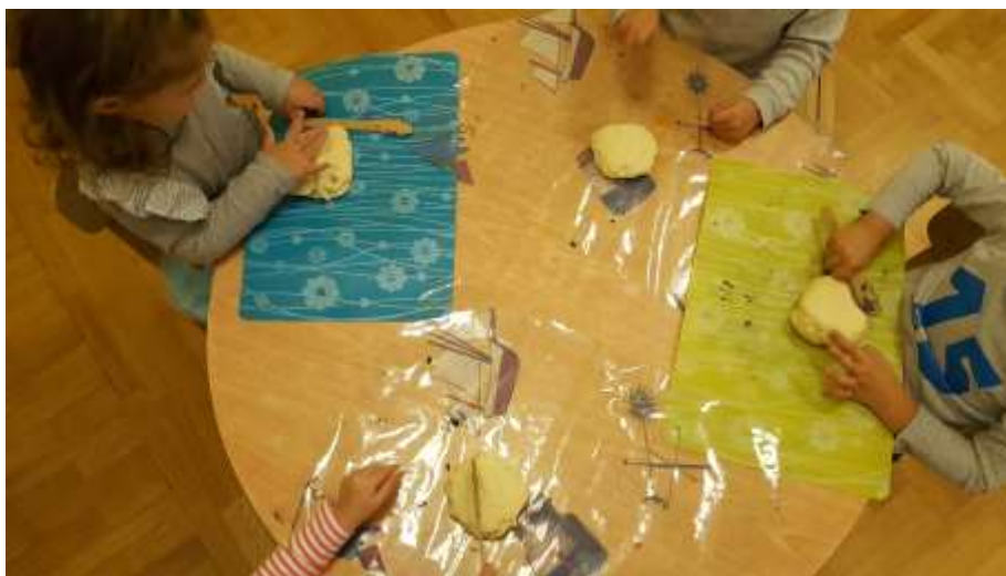
Slika 5. Djevojčica N.Z. promatra što radi djevojčica N.D.

Na samom početku aktivnosti djeca promatraju dječaka M.B. što radi. Osluškuju zvuk koji se čuje. Neki malo hrabriji odlučuju da žele i oni raditi isto to što i taj dječak. Primijetila sam da je mlađoj djeci potrebna pomoć pri udaranju. Vrlo brzo nakon prezentiranja pokušavaju samostalno to učiniti. U samom procesu fasciniralo ih je zvuk i udarac od tijesto. Ponaivaljali su nekoliko puta za redom. Aktivnost je dosta dugo trajala te su se djeca izmjenjivala. Odgojitelj je bio u ulozi promatrača te je pustio da tijekom aktivnosti određuju djeca.