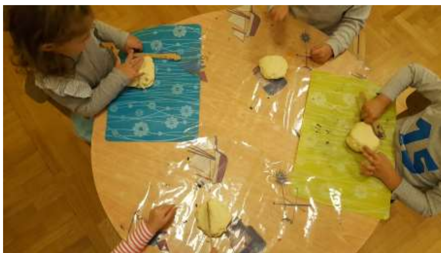
Slika 9. Ravnanje tijesta s drvenim nožićem

Rezali su tijesto drvenim nožićima. Mlađoj djeci je bilo lakše razdvajati tijesto s rukama nego koristiti se s nožićem. Dok su tijesto razdvajali rukama primjetila sam da su se jako iznenadili kada su ugledali tijesto u desnoj pa u lijevoj ruci. Zatim su tijesto spustili na stol i počeli ga modelirati.