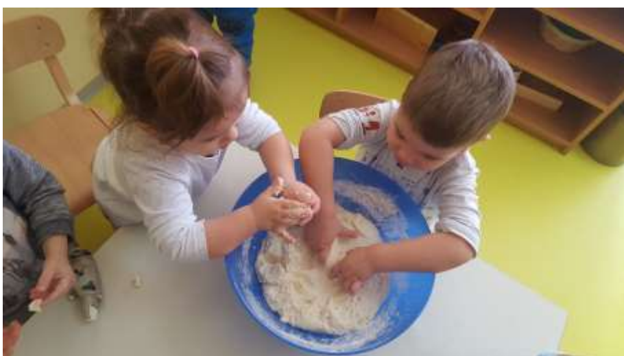
Slika 5. Izrada slanog tijesta