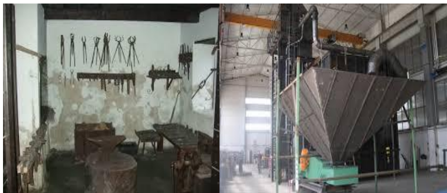
Slika 2. Razlika gospodarstva nekada i sada ( https://www.google.hr/search?q=midi+ivanovec )

U poslove obrta spadalo je tkanje domaćeg platna od obrađivanog lana i konoplje. To je bio dosta kompliciran i dugotrajan posao. Takvih obrtnika bilo je nekoliko. Šusteri su popravljali obuću koja se nabavljala na sajmu. Obrtnički radovi i razni popravci obavljali su se unutar sela i domaćinstva. Sve je bilo jednostavnije i skromnije.