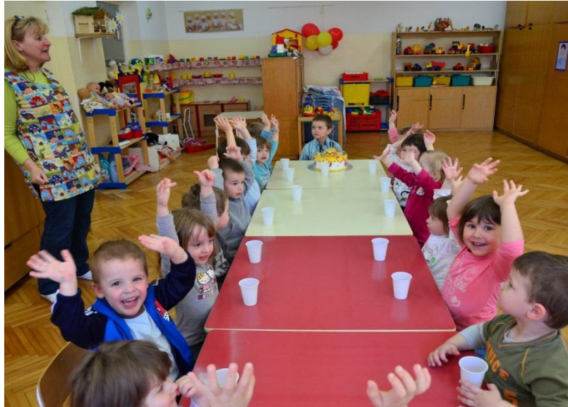
Slika 4. Dječji vrtić Pčelice (www.dvck.hr/pcelice)

Dječji vrtić je u današnje vrijeme jako dobro prihvaćen i cijenjen kao korisna predškolska ustanova koja odgajanjem, njegom i brigom djetetu omogućuje bezbrižan boravak, a roditeljima omogućuje da bez problema obavljaju svoju radnu djelatnost jer su djeca kroz to vrijeme u svemu zbrinuta.