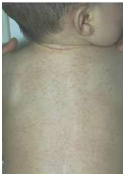
Slika 8: Šesta osipna bolest ili trodnevna groznica kod djece 10