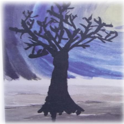
6.Prikaz slike djeteta od 9 godina 6

Prema Škrabina (2013) faza likovnog razvoja za djecu između devet i dvanaest godina naziva se faza realizma. U ovoj fazi djeca, želeći postići što realniji dojam, sve više koriste linije, oblike i detalje na složeni način, javljaju se prvi pokušaji crtanja u određenoj perspektivi, ljudska figura je puna detalja i raznolikih elemenata – posebno s obzirom na spol (Škrabina, 2013). Prema Malachiodi (1998, u Škrabina 2013) u ovoj fazi je karakteristična upotreba boje i nijansiranje te boje. Mnoga su djeca u ovoj fazi obeshrabrena i prestaju crtati, osim ako je okolina dovoljno poticajna i omogućuje im priliku za daljnji razvoj kreativnih vještina.