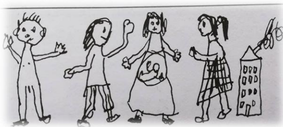
4. Prikaz crteža čovjeka djeteta od 5 do 6 godina 4 djeteta od 6 do 8 godina 5

Osim oslabljivanja perceptivnih i misaonih funkcija, dijete gubi sposobnost vlastitog likovnog izražavanja jer preuzimanje shema kod djeteta djeluje razarajuće na razvoj tih područja (Grgurić i Jakubin, 1996).