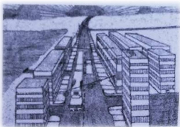
7. Prikaz cteža djeteta od 12 godina 7

oni koji ustraju su u stanju jasnije koristiti perspektivu već od trinaeste godine, uključuju sve veće bogatstvo izražavanja detalja na crtežu, povećava im se kritička percepcija okoline i postaju sposobni stvarati apstraktne slike.