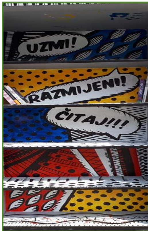
Slika 3. Javni regal za dijeljenje i razmjenu knjiga

Regal za dijeljenje i razmjenu literature, u centru Svetog Ivana Zelina, mjesto je razmjene knjiga i drugih publikacija. Građani se smiju služiti njime i njegovim sadržajem, puniti ga izdanjima čijeg se vlasništva dobrovoljno odriču, posuđivati odnosno uzimati knjige i publikacije, koje mogu ali ne moraju vratiti. Projekt je osmislilo i realiziralo Pučko otvoreno učilište Sv. Ivan Zelina, na dobrobit svih mještana odnosno članova lokalne zajednice. Na zelinski je trg regal instaliran u lipnju 2018., za vrijeme 1. Međunarodnoga književnog festivala sa sajmom knjige.