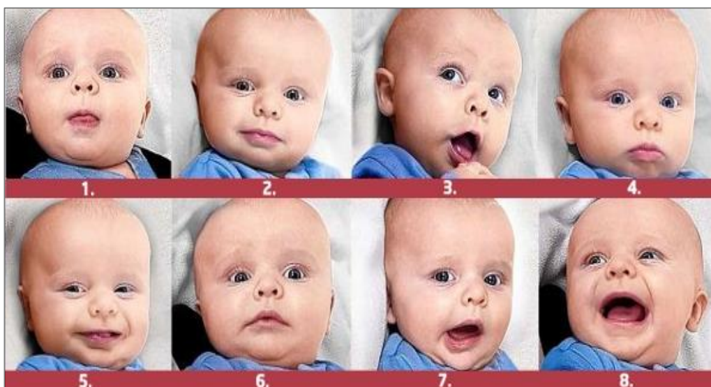
Slika 3: Neverbalna komunikacija kod djeteta ( https://www.google.com/search?client=firefox-b-ab&biw=1366&bih=654&tbm=isch&sa=1&ei=h76PW-jvBMiLgAbJ7JC4DQ&q=neverbalna+kommunikacija+kod+djece&oq=neverbalna+kommunikacija+kod+djece&gs_l=img.3..0i24k1.363426.363686.0.364456.2.2.0.0.0.128.227.1j1.2.0....0...1c..64.img..0.1.127....0.ruwzDDhkK90#imgc=D5W5xf-6QKQITM: )