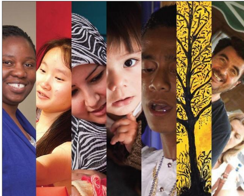
Slika 4: Komunikacija različitih kultura ( https://www.google.com/search?client=firefox-b-ab&biw=1366&bih=654&tbm=isch&sa=1&ei=9L-PW_aONsqqsWgm-pPgBQ&q=kommunikacija+razli%20dite+kulture&oq=kommunikacija+razli%20dite+kulture&gs_l=img.3...357697.367186.0.367493.30.28.0.2.2.0.301.3511.0j22j1j1.24.0...0...1c.1.64.img..4.13.1672...0j0i67k1j0i30k1j0i5i30k1j0i24k1.0.AWFZwyUIN5o#imgrc=uqRPWDyIKg3ieM: )