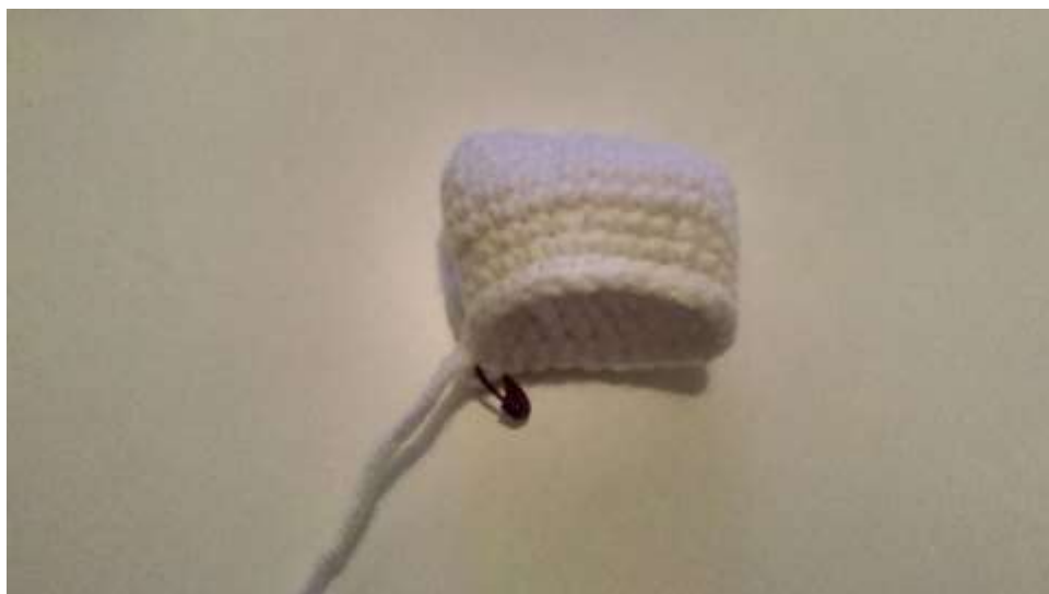
Slika 8 Prsa

Sa završenim prsima koja sam napunila rižom spojila sam glavu s drvenim štapićem kako glava ne bi padala te zašila zajedno.