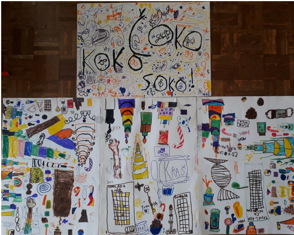
Plakat sa sloganom