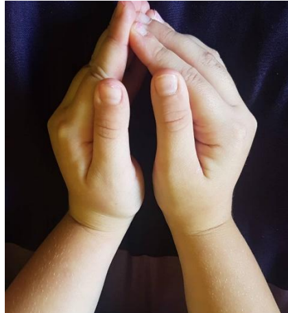
Slika 21 Ruke u položaju "zatvorenog" cvijeta