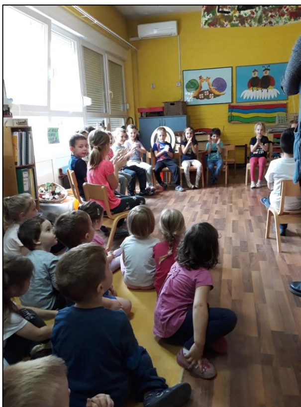
Slika 2. Dramska igra u vrtiću – primjer provedene aktivnosti

U skupini sam boravila nekoliko dana te sam djecu upoznala. U njoj prevladavaju dječaci koji su dosta okupirani motoričkim igrama, ali uvijek spremni pomoći prijatelju. Vole superjunake i u vrtić svakodnevno donose figurice njihovih oblika.