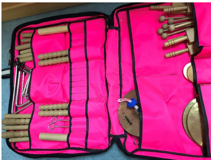
Slika 9. Prikaz "glazbene torbe"

Najzanimljivija je glazbena torba koja je popunjena instrumentima. Radi se o dvadeset i dva štapića, devet trokutića, dvije kastanjete, četiri činele i pet malih bubnjeva.