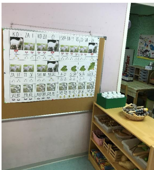
Slika 8. Prikaz glazbenog centra skupine "Mace"

Najzanimljivija je glazbena torba koja je popunjena instrumentima. Radi se o dvadeset i dva štapića, devet trokutića, dvije kastanjete, četiri činele i pet malih bubnjeva.