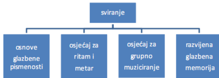
Slika 2. Uvjeti uspješnog sviranja