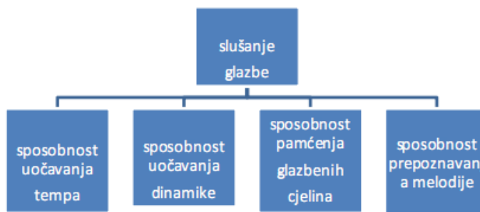
Slika 3. Uvjeti uspješnoga slušanja glazbe