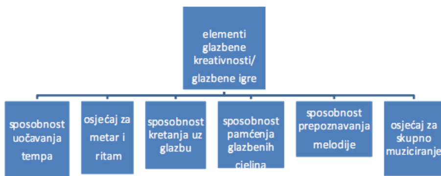
Slika 4. Uvjeti uspješnog izvođenja elemenata glazbene kreativnosti

samopouzdanje kod novih ideja (Nastavni plan i program za osnovnu školu, 2013).