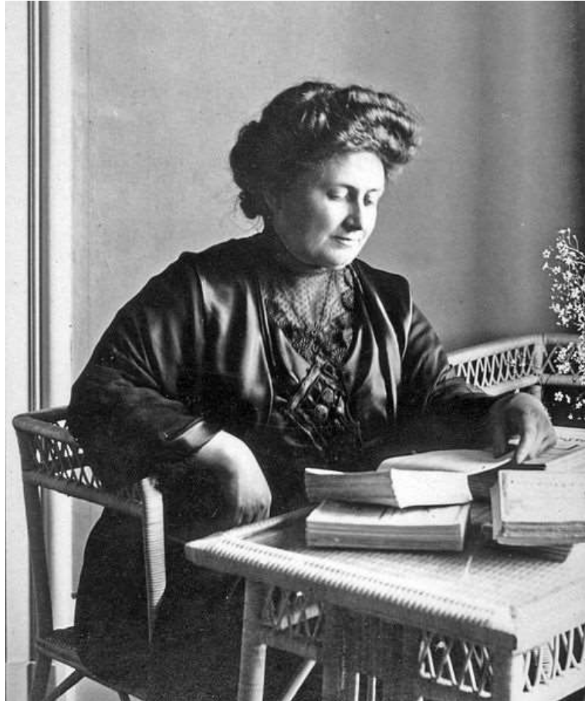
Slika 1: Maria Montessori 1

Međutim, valjalo je potražiti stručnjake u radu s mentalno zaostalom djecom. Tada je pronašla rad dvojice francuskih liječnika – Jeana Itarda i Edouarda Seguina. Itard se bavio proučavanjem gluhonijeme djece, no postao je poznatiji po svojim dugogodišnjim pokušajima da odgoji i socijalizira dječaka koji je pronađen u šumama gradića Aveyrona. Svoj napor je prikazao u knjizi Divlji dječak iz Aveyrona . Njegov glavni pristup podučavanju tog dječaka je bio da se sustavno podražava dječakov mozak putem osjetila. S druge strane, Seguin je bio Itardov student koji je osnovao svoju školu za slaboumne u Parizu. Kako bi izazvao promjene u ponašanju te na taj način podučio i odgojio dijete, Seguin je osmislio niz vježbi koje uključuju mišiće, a svoju metodu je opisivao kao fiziološku (Britton, 2000).