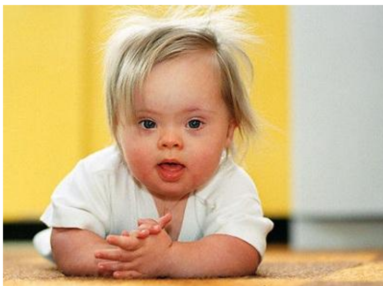
1. slika Dijete s Down sindromom

Osobe oboljele od Downova sindroma je vrlo važno od malena poticati na samostalnost kako bi im se život uvelike olakšao, treba im omogućiti pomoć logopeda kako bi se ispravio govor. Isto tako mora se provoditi fizička aktivnost kako bi se mišići učvrstili i bili pokretljiviji.