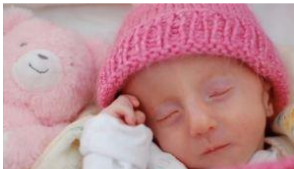
5.slika, Djevojčica s Edwardsovim sindromom

Na dijagnozu se može posumnjati već i prenatalno na osnovu ultrazvuka, a postnatalno prema izgledu djeteta, no dijagnoza se u oba slučaja potvrđuje kariotipizacijom 6 (MSD, 2004.).