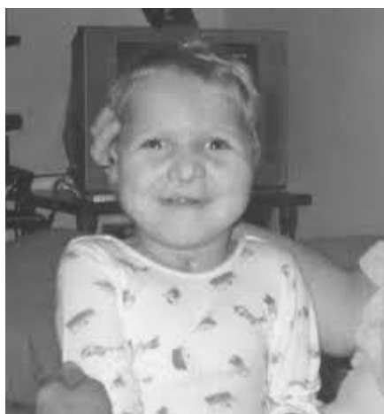
4. slika Djevojčica oboljela od trisomije 13 (Patauov sindrom)

U Hrvatskoj je zabilježen slučaj djevojčice koja je sa Patauovim sindromom doživjela 12-u godinu života što je najduži životni vijek s navedenim sindromom. (V. Čulić i sur., 2016.)