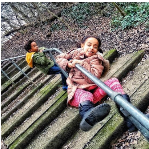
Slika 1. Spontana dječja aktivnost

U jednostavno tjelesno vježbanje spada spontano vježbanje, tematsko tjelesno vježbanje te jutarnje razgibavanje. Neljak (2010) objašnjava spontano vježbanje kao skup aktivnosti koja nisu planirana već ih djeca samostalno provode. Nema uloge voditelja koji određuje što će koje dijete raditi, a djeca sama biraju sadržaj koji će raditi. To su jednostavni kratki motorički zadaci kojima djeca razvijaju svoje sposobnosti. Djeca s jedne aktivnosti prelaze na drugu kada izgube interes i kada ih privuče nešto novo. Spontano vježbanje trebalo bi se provoditi svakodnevno, ali ne smije biti zamjena za sat tjelesne i zdravstvene kulture jer se na satu tjelesne kulture provode točno određene zadaće i ciljevi. Uloga voditelja je da dobro prati aktivnost djece s ciljem čuvanja. Kada dijete izvoditi prezahtjevan spontani zadatak za njegove mogućnosti voditelj mora reagirati kako mu se nešto ne bi dogodilo. Pod spontano vježbanje ubraja se ljuljanje, klackanje, igranje u pijesku i slično.