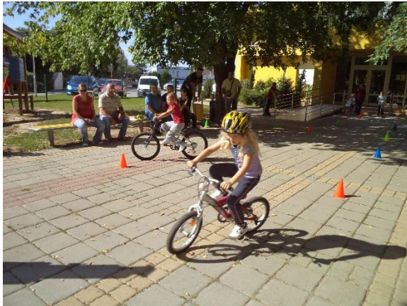
Slika 2. Vožnja biciklom

do trideset minuta (Neljak, 2010). Primjer za tematsko vježbanje je trčanje za balonima, vožnja biciklom itd.