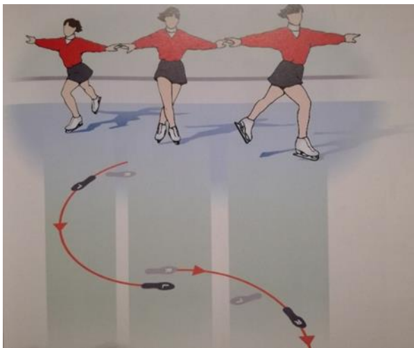
Slika 2: „Cross rolli“ (Izvor: Morrisey i Young, 2000.)

U „cross rollima“ naprijed, djeca kližući unaprijed naizmjenice prebacuju jednu nogu preko druge uz paralelno prebacivanje težine te zategnutim tijelom i rukama u položaju odručenja. „Cross rolli“ natrag rade se na isti način te u istom položaju pri čemu se djeca kreću unazad. Navedeni element se izvodi u najnaprednijoj grupi, koju čine djeca koja su se prethodno više puta susrela s ledom te usavršila sve prethodno navedene elemente (Morrisey i Young, 2000; Mikulec, 2006). Kada se uvidi da su djeca poprimila osjećaj za navedene korake, te isto tako usavršila osnovne oblike kretanja na ledu, kao i osnovne ravnotežne položaje, tada je moguće slagati jednostavnu kombinaciju koraka od najviše tri elementa. S obzirom na to da je element „cross rolli“ najkompleksniji u izvedbi elemenata za djecu predškolske dobi, priložena je slika radi lakšeg razumijevanja smjera kretanja na ledu kao i same izvedbe.