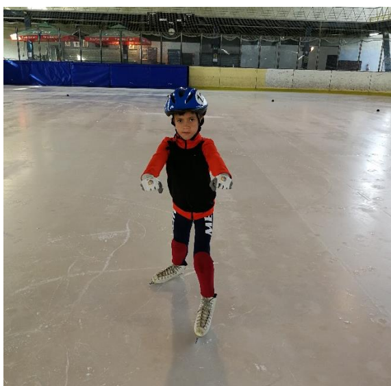
Slika 7: „Romobil“

Ukoliko se uoči da dijete ima poteškoća u konačnom obliku odraza ili mu jedna noga slabije radi, što je vrlo često moguće, utoliko se uvodi dodatna vježba, element „romobil“ o kojem zasad još nitko od autora koji se bave ovom tematikom nije posebno pisao. Navedeni element izvodi se tako da je oslonac na jednoj nozi koja je savijena u koljenu, ruke su u predručenju i tijelo blago nagnuto na ruke, a slobodna noga radi odraze. Međutim nije nužno uočiti pogrešku u odrazima prije izvođenja ovog elementa. Naime, kako je još uvijek riječ o elementima u početnoj grupi škole klizanja, djeci je neobično spuštati se u koljenima te su im vrlo često koljena kruta i ukočena. Odrzi s ravnih nogu su nepravilni te onemogućavaju postizanje kliznosti i brzine. Element „romobil“ omogućit će djeci da opuste koljena i lakše osjete samu izvedbu odraza. Slika 7. prikazuje element „romobil“ radi lakšega predočjenja samog elementa kao i njegove izvedbe.