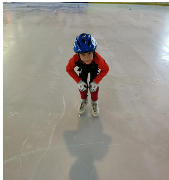
Slika 4: Drugi korak u podizanju