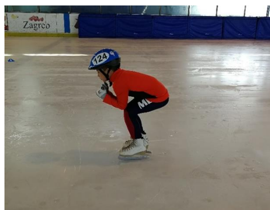
Slika 11: „Skijaš“