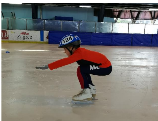
Slika 10: „Čučanj“

Element čučanj se izvodi tako da se dijete prvo zaleti odrazima, potom noge postavi u širini ramena, a ruke postavi u predručenje. Zatim započinje spuštanje u koljenima sve dok kukovi ne budu u malo višoj poziciji od koljena. Leđa su blago nagnuta prema rukama zbog održavanja ravnoteže. Dok se izvodi ovaj element potrebno je postići osjećaj kao da se sjedi na stolcu. Djecu je potrebno upozoriti da gledaju ravno ispred sebe u smjeru kretanja te da što niže spuštaju kukove (Hagen, 1995). Osim klasične pozicije čučnja koja je prikazana na Slici 10., s djecom se radi i pozicija čučnja u kojoj dijete postavlja oba lakta na koljena. Takva pozicija zove se „skijaš“ te je prikazana na Slici 11.