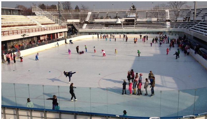
Slika 1: Škola klizanja KK „Medveščak“

U programima škole klizanja djeca su podijeljena po grupama, a to su početna, napredna i najnaprednija grupa, a radi lakše organizacije kasnije se dijele i u podgrupe. Navedene grupe postavljene su po širini leda kao što je vidljivo na slici 1.