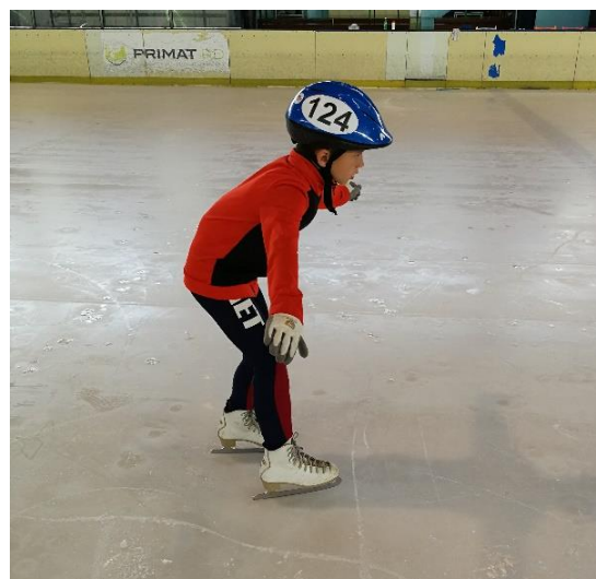
Slika 9: „Drugi način zaustavljanja“