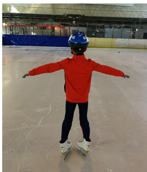
Slika 14: Završetak elementa „ribice“