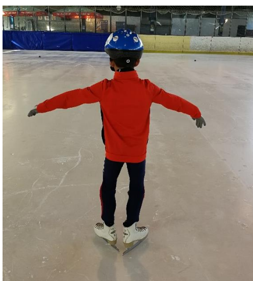
Slika 13: Početak elementa „ribice“

Tehnika izvođenja elementa „ribice“ i „slalomi“ opisana je u prethodnom poglavlju, a sada će biti obrazložena metodika učenja navedenih elemenata, najčešće pogreške kao i slikovni prikaz koji dodatno pojašnjava izvedbu. Slika 13. prikazuje početnu poziciju pri izvođenju elementa „ribice“ odnosno ulaz u element kada se klizač treba spustiti u koljenima. Slika 14. prikazuje izlaz iz navedenog elementa kada se klizač podiže iz koljena, zatvara noge te ponovno izravna koljena. Opisano podizanje i spuštanje u koljenima daje klizaču potrebnu brzinu za uspješnu izvedbu.