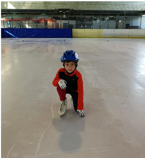
Slika 3: Prvi korak u podizanju

Padanje se uči isključivo prema naprijed, odnosno na dlanove i koljena kako ne bi došlo do pada na leđa ili glavu. Poslije svakog pada potrebno je što brže se ustati. Stoga se s djecom uvježbava podizanje preko koljena. Podizanje započinje u klečećem položaju, potom dijete podigne jedno koljeno i na njega stavi jedan dlan, dok drugi postavi na led. Ruke su te koje dodatno pomažu djetetu da se podigne s leda, tako da se s njima pomalo odgurne od leda (Mikulec, 2006). Priložene slike opisuju postupak podizanja u tri koraka.