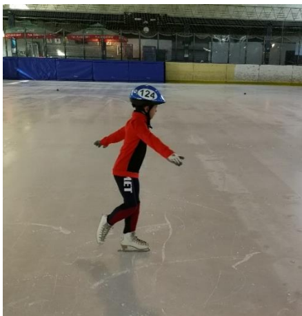
Slika 12: Element „Roda“

Prvi ravnotežni položaj koji se uči je element „roda“ odnosno klizanje prema naprijed na jednoj nozi. Sljedeći su koraci koje je potrebno učiniti za uspješnu izvedbu: kliziti po ledenoj površini na dvije noge s rukama u odručenju, potom je potrebno podignuti jednu nogu i prebaciti svu težinu na nogu koja je ostala na ledu, a slobodnu nogu postaviti uz zglob noge na ledu. Kako ne bi došlo do skretanja nužno je ujednačiti ramena i kukove te ih okrenuti prema naprijed (Hagen, 1995). Zategnute ruke postavljene u položaj odručenja dodatno olakšavaju postizanje i održavanje ravnoteže. Slika 12. prikazuje izvedbu opisanog elementa.