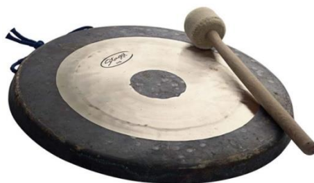
Slika 16. Tam-tam