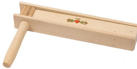
Slika 22. Čegrtaljka