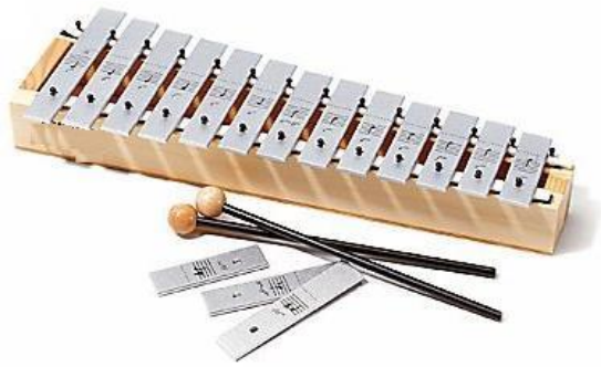
Slika 3. Metalofon