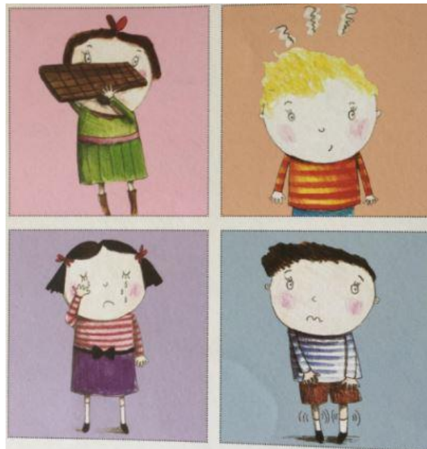
Slika 1: Memory osjećaja (iz knjige Sva lica osjećaja)

Osim izraza lica, držanja i pokreta tijela djeca mogu primijetiti i fiziološke promjene i drugačije ponašanje kod sebe za vrijeme osjećaja tuge (Pešec, Kozonić-Krešić, Dragun, 2015).