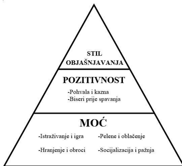
Slika 2: Piramida optimizma (prema knjizi Optimistično dijete )

Seligman objašnjava kako pesimistični ili optimistični stil objašnjavanja poprima svoj oblik do djetetove osme godine života. Da bi dijete postalo optimist potrebno je da svjesno odbaci stari način razmišljanja, tj. pesimistični i krene u pustolovinu učenja optimističnog. Dijete u svakom trenutku može promijeniti svoj stil objašnjavanja ako je fleksibilno i otvoreno ka promjeni. U prošlosti su možda bili pesimisti, ali ako pokušaju biti optimisti u budućnosti sigurno neće zažaliti (Seligman, 2005; prema Pavlič, 2014). „Stil objašnjavanja razvija se u djetinjstvu i postaje, ukoliko nema izravne intervencije, doživotan.” (Seligman, 2005, str. 45) Zato na odgojitelju leži odgovornost da promiče optimizam u odgojno-obrazovnoj ustanovi svojim primjerom te da svoj pogled na svijet prenese djeci kako bi i ona mogla sudjelovati u stvaranju ljepšeg mjesta za život. Kod male djece optimizam se može poučiti pomoću 3 principa, a to su: moć, pozitivnost i stil objašnjavanja (Seligman, 2005).