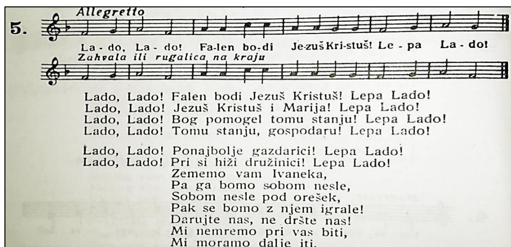
Slika 21. Zapis pjesme (Podravina) Lado, Lado (Ivančan, 1989: 66)