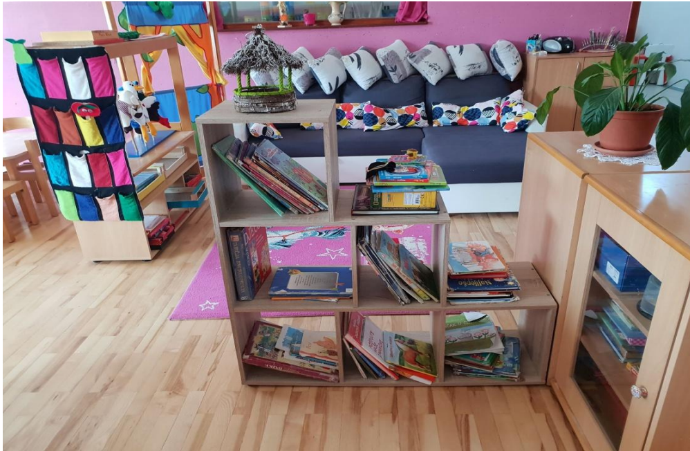
Slika 1. Kutak s knjigama te prostor za čitanje - bitan poticaj

Odgojno-obrazovne ustanove dobro su upoznate s važnošću čitanja te važnosti djetetovog iskustva s knjigom i tiskanim materijalom. Važno je dijete okružiti brojnim slikovnicama i knjigama koje se čitaju djetetu. Takva poticajna okolina kod djeteta potiče zanimanje za slova i čitanje.