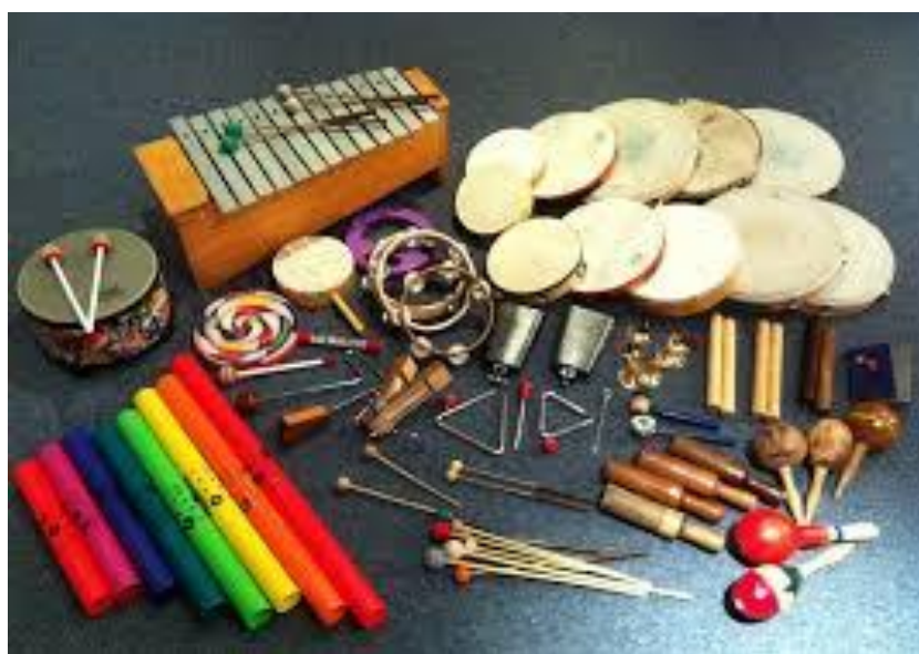
Slika 1. Prikaz Orffovog instrumentarija

Orffov instrumentarij u hrvatskim je školama zaživio sredinom šezdesetih godina dvadesetog stoljeća, kao neizostavno metodičko pomagalo u nastavi glazbene kulture, u području pjevanja, plesanja i ostalih aktivnosti u razredu. Premda nije samostalan metodički pristup, povezan je s drugim metodama rada u nastavi. U nastavi glazbene kulture preporučuje se korištenje Orffova instrumentarija, osobito prilikom uvježbavanja naučene pjesme ili u drugim aktivnostima na satu. Na Slici 1 prikazani su instrumenti prema Orffovu glazbenom sustavu.