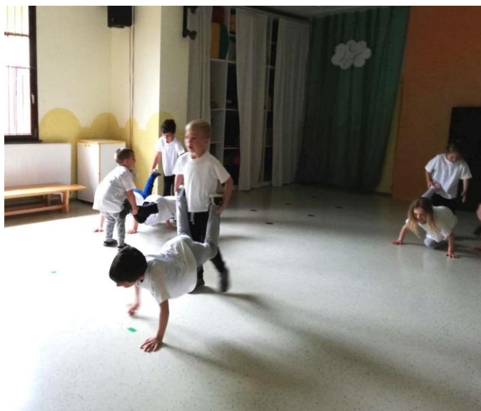
Slika 1. Rad u parovima; tačke