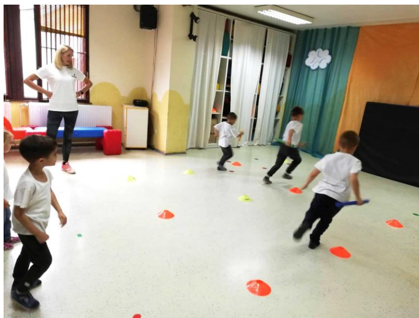
Slika 6. Glavni „B” dio sata

Mjerenje je provedeno pomoću sata i štoperice. Sat je uključen na početku sata i isključen na kraju sata; sat tjelesne i zdravstvene kulture za srednju dobnu skupinu iznosi 30 minuta. Štoperica je uključivana na početku aktivnosti, odnosno u trenutku kada je dijete počinjalo s vježbanjem, a isključivana prilikom prekida aktivnosti, odnosno u trenutku kada je dijete prestajalo s vježbanjem. Rezultati su obrađeni metodama deskriptivne statistike i grafički.