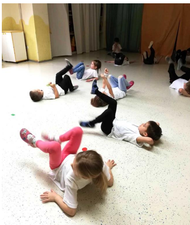
Slika 4. Opće pripremne vježbe