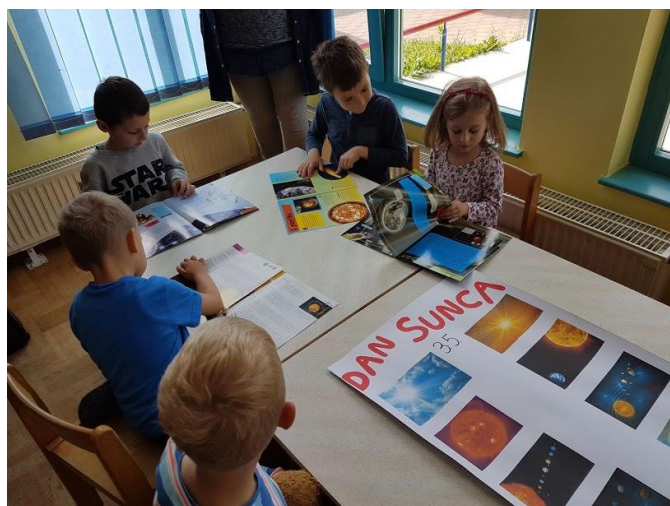
Slika 16. Proučavanje knjiga o Suncu