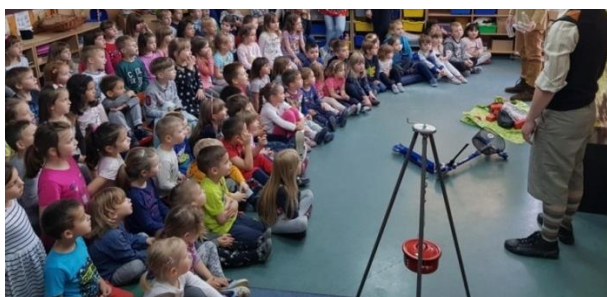
Slika 2. Predstava Hrčak i Smrčak u vrtiću