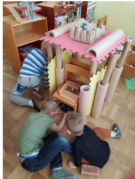
Slike 11., 12., 13. i 14. Gradnja rakete u građevnom centru