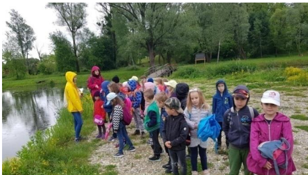
Slika 1. Izlet predškolaca u Žabnik

Osim navedenih događanja, priredbi i manifestacija u kojima su djeca iz DV Vrapčić sudjelovala tijekom svibnja u spomenutom su mjesecu u vrtiću obilježili i neke važnije datume, te proveli nekoliko tematskih dana.