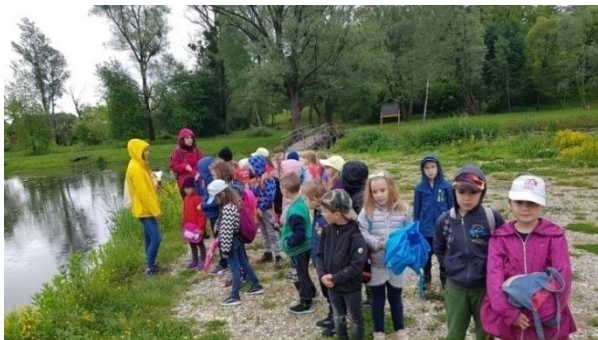
Slika 1. Izlet predškolaca u Žabnik

Osim navedenih događanja, priredbi i manifestacija u kojima su djeca iz DV Vrapčić sudjelovala tijekom svibnja u spomenutom su mjesecu u vrtiću obilježili i neke važnije datume, te proveli nekoliko tematskih dana.