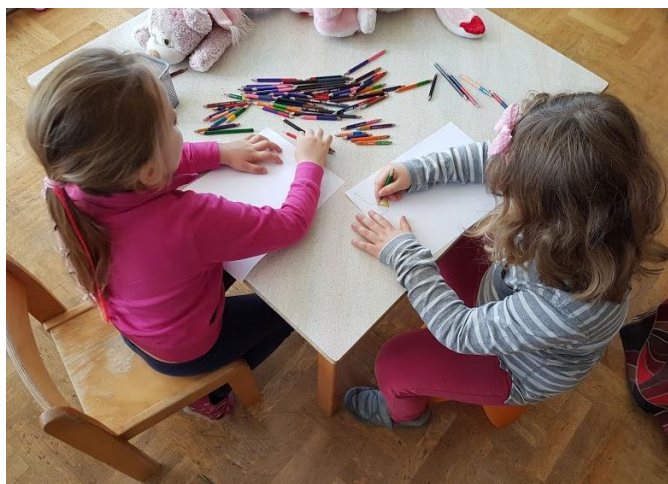
Slika 15. Crtanje Sunca i Mjeseca