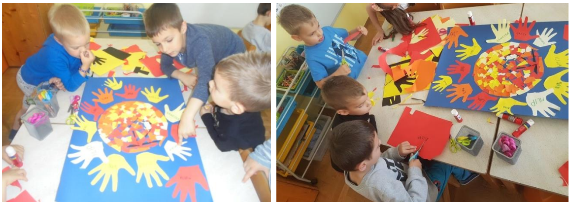
Slike 17. i 18. Izrada sunčevih zraka od dječjih dlanova