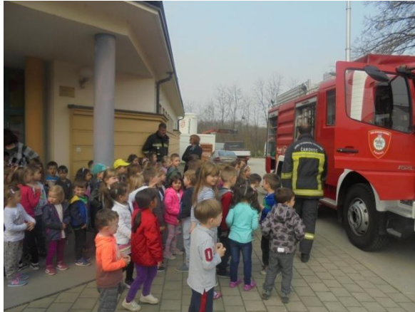
Slika 3. Razgledavanje vatrogasnog vozila