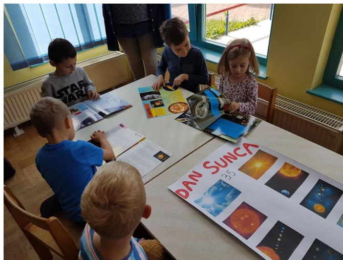
Slika 16. Proučavanje knjiga o Suncu