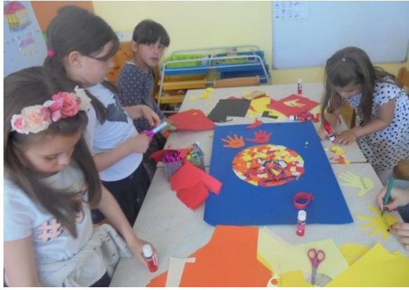
Slike 8., 9. i 10. Izrada sunca u obliku mozaika