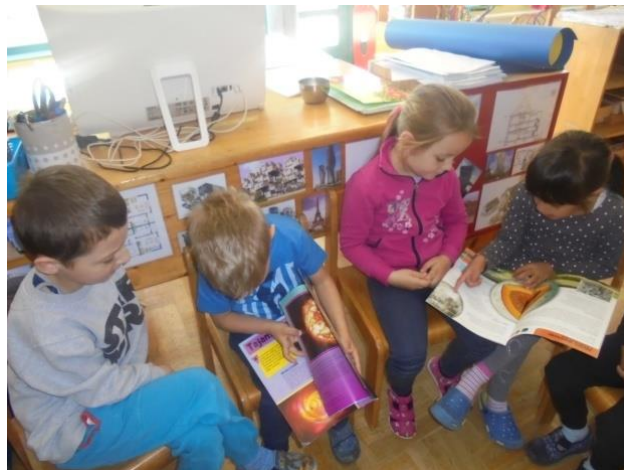
Slike 5., 6. i 7. Listanje knjiga-enciklopedija o Suncu