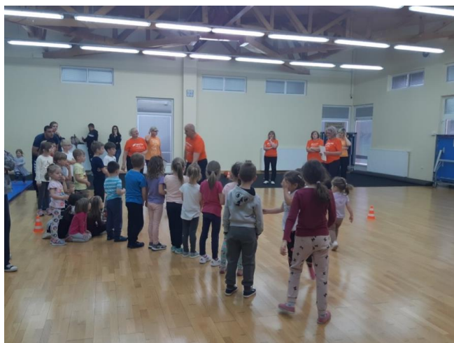
Slika 20. Vrtićanci na „Move week-u“