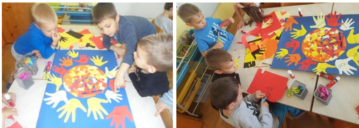
Slike 17. i 18. Izrada sunčevih zraka od dječjih dlanova