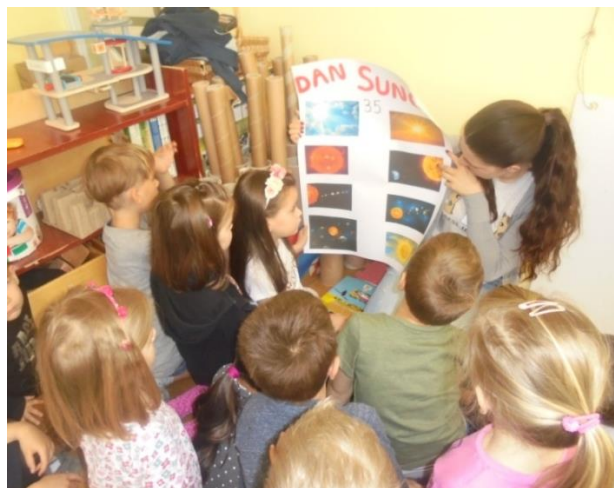
Slika 4. Motivacijski razgovor i priča uz plakat sa slikama