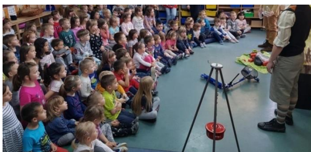
Slika 2. Predstava Hrčak i Smrčak u vrtiću