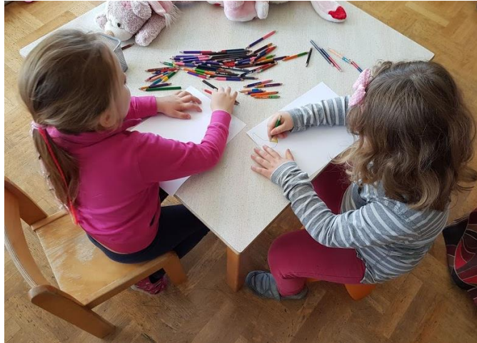
Slika 15. Crtanje Sunca i Mjeseca