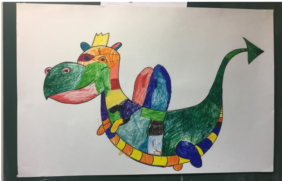
Slika br. 2. Obojana silueta zmaja

Nakon što je zmaj bio obojen, svi učenici su se pridružili igri Pokvarenog telefona.