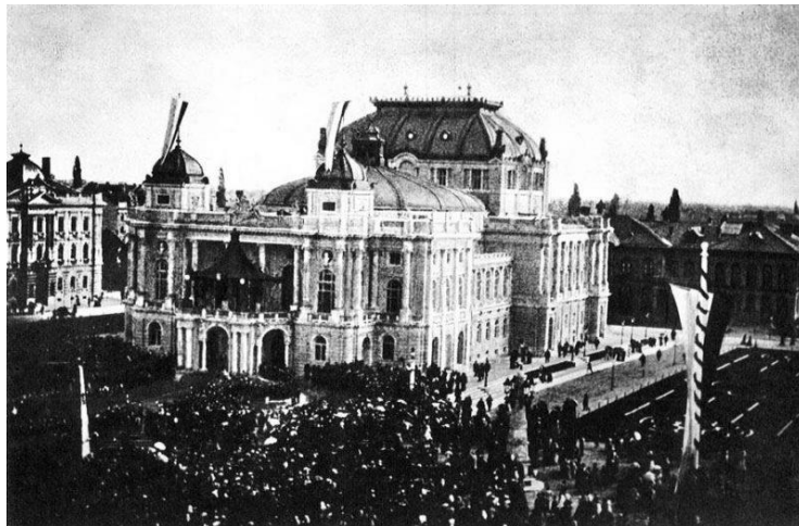
Slika 2. Prikaz otvorenja zgrade Hrvatskog narodnog kazališta u Zgrebu 1895. godine

Konac devetnaestog i početak dvadesetog stoljeća obilježen je uređenjem sredina za kvalitetno provođenje slobodnog vremena kroz tjelesnu aktivnost na čistom zraku pa su uređivali parkovi, igrališta, vrtovi i klizališta. Gradili su se stadioni, trkališta, muzeji, otvarala kazališta, pučka i radnička sveučilišta, čitaonice i knjižnice.