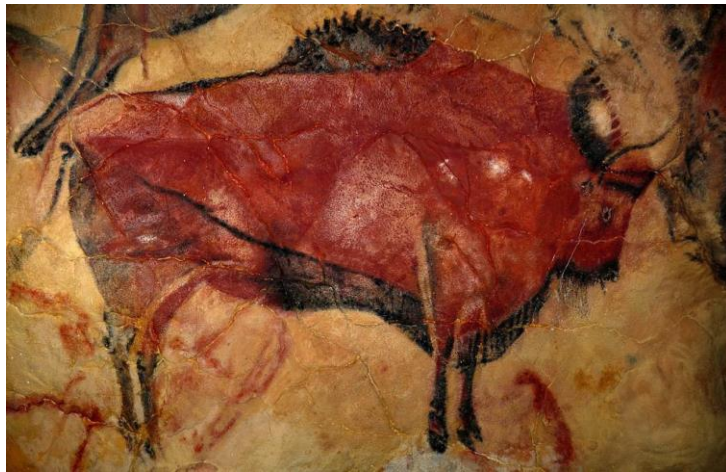
Slika 1. Prikaz oslikavanja nastambi spilje Altamira, Španjolska, 33.000 g. Pr. n. e.

Slobodno vrijeme predmet je rasprava još od antičkog doba, a i danas je aktualan. Međutim, tek u industrijskom društvu proučava se kao društveni fenomen. U prvim civilizacijama slobodno vrijeme bilo je neodređeno vrijeme, a danas je neizostavni dio svakodnevice svakog pojedinca. Nalazi prvih civilizacija pokazuju da je za ljude tog doba slobodno vrijeme bilo ono vrijeme u koje nisu bili zauzeti za opstanak pa su izrađivali ukrasne predmete, posuđe i oruđe koje im je bilo potrebno za preživljavanje te su oslikavali pećine.