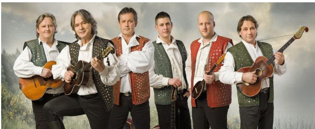
Slika 14. Najbolji hrvatski tamburaši 25

Osim spomenutoga, na repertoaru im je bila i autorska i pučka crkvena glazba, klasična glazba, domaća i strana zabavna glazba pa sve do evergreena engleskog, francuskog i talijanskog područja. U početku, sastav su vodili Marko Benić i Mihael Ferić, a nakon toga, sve do danas ih uspješno vodi Damir Butković koji ujedno svira i berdu u sastavu (Ferić, 2011).