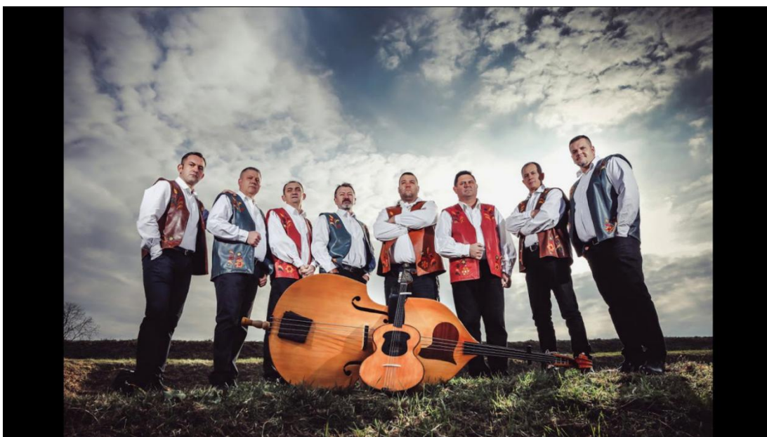
Slika 15. Tamburaški sastav Berde band 26