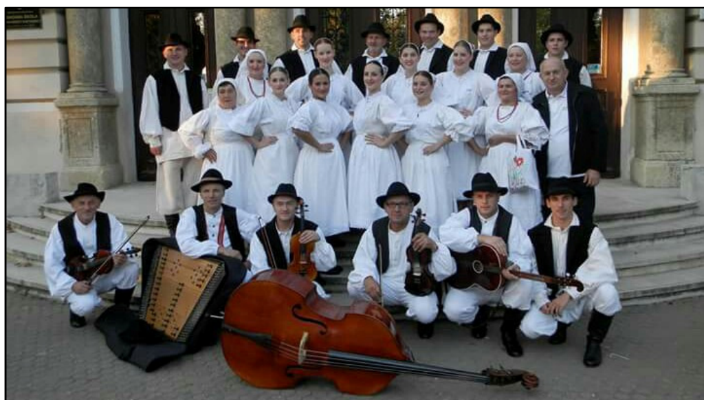
Slika 3. Kulturno – umjetničko društvo Salinovec

Izvor: http://www.ivanec-turizam.hr/index.php/obicaji-i-manifestacije/seoske-igre-u-salinovcu , 21. 6. 2016.