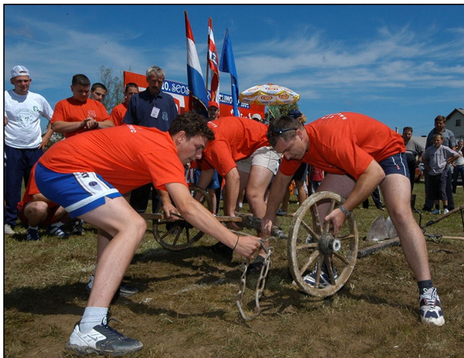
Slika 2. Seoske igre starih sportova