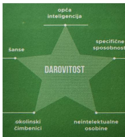
Slika 3. Model zvijezde A. Tannenbauma (Burušić i sur., 2019)