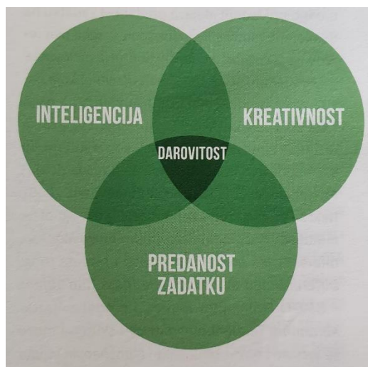
Slika 1. Renzullijev (2005) troprsteni model darovitosti (Burušić i sur., 2019)

Za razliku od Renzullija, Franz Mönks modificira i proširuje Renzullijev troprsteni model i naziva ga multifaktorskim modelom darovitosti (Slika 2.). Dodaje tri ključna čimbenika (škola, obitelj, vršnjaci) koji u korelaciji s individualnim obilježjima rezultiraju darovitošću (Burušić i sur., 2019).