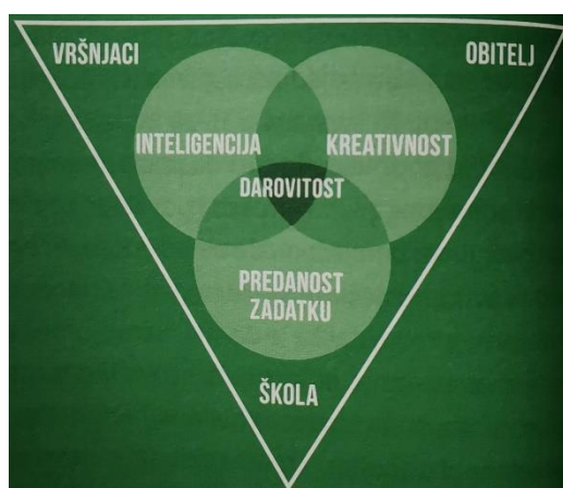
Slika 2. Mönksov multifaktorski model darovitosti (Burušić i sur., 2019)

Za razliku od Renzullija, Franz Mönks modificira i proširuje Renzullijev troprsteni model i naziva ga multifaktorskim modelom darovitosti (Slika 2.). Dodaje tri ključna čimbenika (škola, obitelj, vršnjaci) koji u korelaciji s individualnim obilježjima rezultiraju darovitošću (Burušić i sur., 2019).