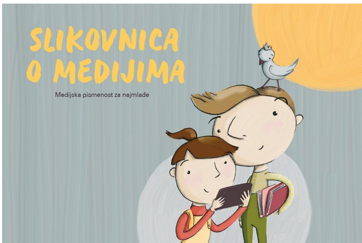
Slika 2. Slikovnica o medijima

slikovnica u kombinaciji s materijalima za Radionicu optičkih igračaka koji su također dostupni besplatno online, ili korištenje slikovnice zasebno. Roditeljima se također preporučuje čitanje slikovnice svojoj djeci te ih podržati u aktivnostima predloženima za prepoznavanje razlika između dva svijeta – svijeta medija i stvarnog svijeta. Slikovnica može i u obiteljskom domu, ali i u dječjem vrtiću ili radionicama poslužiti kao dobar uvod za druge aktivnosti koje su vezane uz medije, za razgovore o medijima i sadržajima istih. „Dodatne ideje za to kako koristiti medije u obitelji, na što obratiti pozornost, o čemu i na koji način razgovarati s djecom – možete pronaći u knjižici za roditelje i skrbnike “Djeca i mediji” 81 .