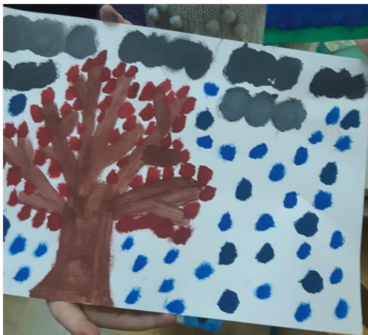
Slika 6: Prikaz nepotpunog dječjeg rada