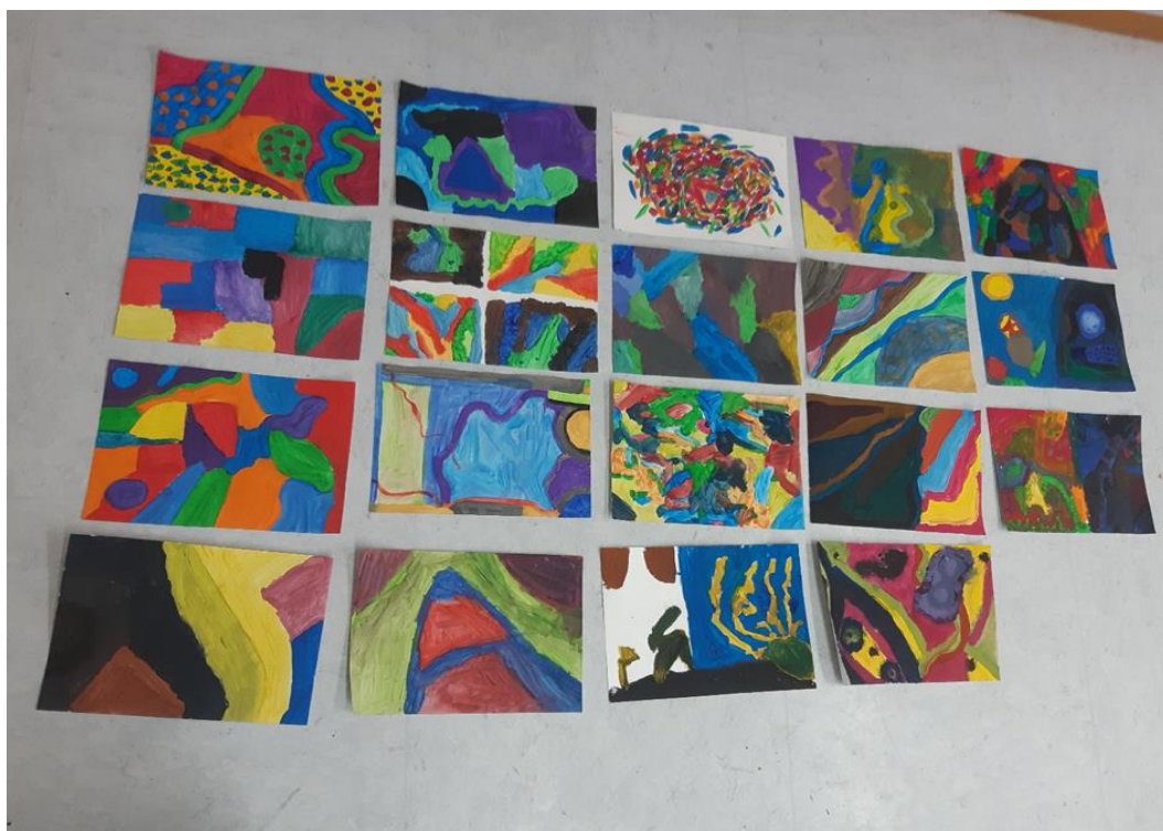
Slika 4: Prikaz učeničkih radova na temu sata kompozicija i nijanse boja

Učenici su brže i lakše, na njima zanimljiviji način, usvojili nastavni sadržaj kompozicije i nijansi boja. Tijekom rada bili su opušteniji te su zadatku pristupili s više zanimanja i izvršili ga na kreativniji način.