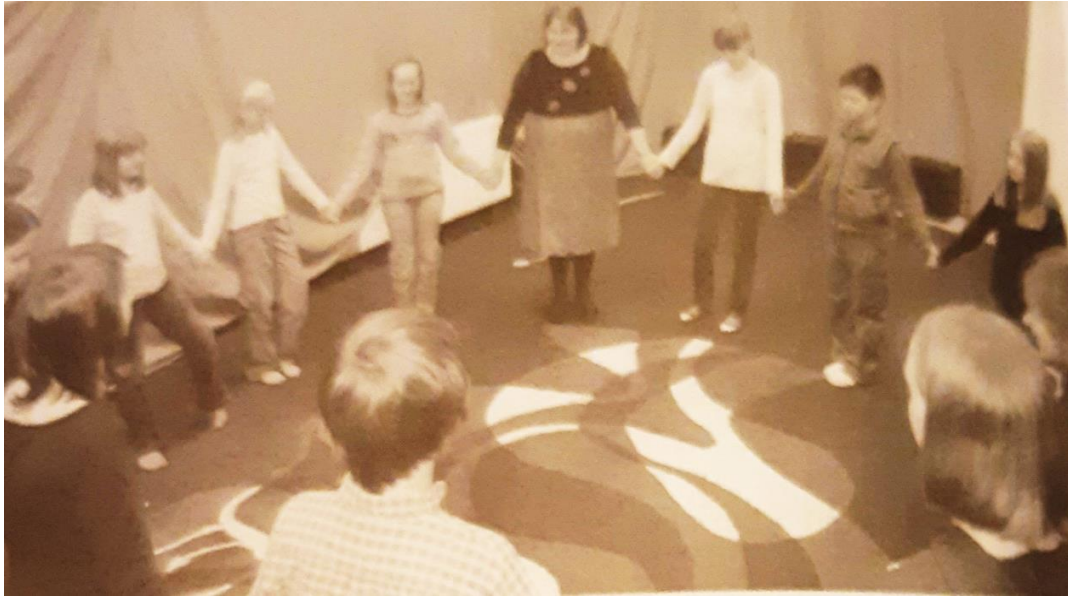
Slika 3: Prikaz igre strujni krug