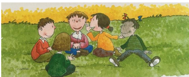
Slika 4: „Pitanja i odgovori“ (Allue, Fiella i Garcia, 2001, str. 9)

Učenici sjede u krugu (slika 4). Prvi učenik šapćući postavi pitanje prijatelju koji mu sjedi s desne strane, a on njemu odgovara također šapćući. Nakon toga učenik koji je odgovarao na pitanje, postavlja pitanje prijatelju koji sjedi s njegove desne strane i upamti njegov odgovor kao da je odgovor na pitanje koje je njemu bio postavio prvi učenik. I tako sve dok ne dođu svi učenici u krugu na red. Nakon toga svaki učenik naglas kaže pitanje koje mu je bilo postavljeno i odgovor koji je dobio tako da kaže: „S ove strane su me pitali ( koliko imam godina), a s ove strane su mi odgovorili ( cvijeće).“