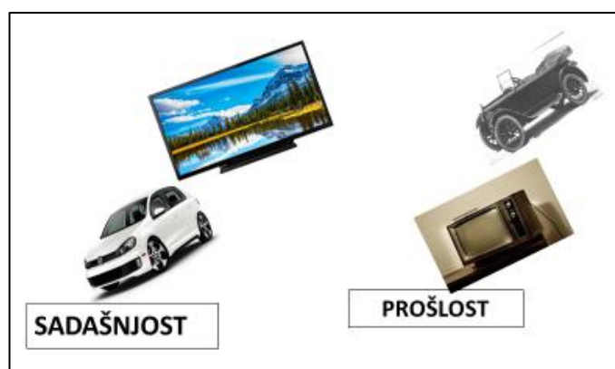
Slika 3: „Sadašnjost, prošlost, budućnost“

najmaštovitiji. Pobijedila je skupina koja ima sve točno raspodijeljeno i najmaštovitije crteže za izgled predmeta u budućnosti.