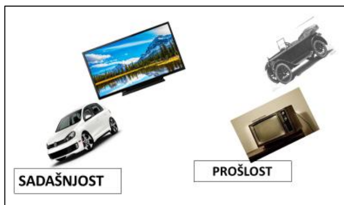
Slika 3: „Sadašnjost, prošlost, budućnost“

najmaštovitiji. Pobijedila je skupina koja ima sve točno raspodijeljeno i najmaštovitije crteže za izgled predmeta u budućnosti.