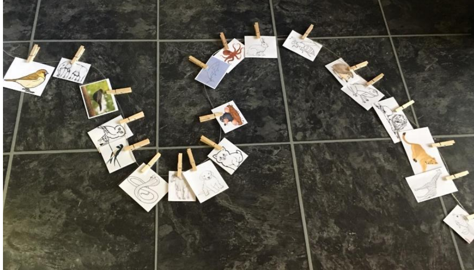
Fotografija 2: „Životinje u redu“ završetak igre