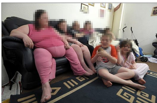
Slika 6 Pretila obitelj u provođenju loše navike

Energetske su potrebe djece visoke zbog rasta. Raznovrsna i zdrava prehrana izuzetno je važna za rast i razvoj, ali ako se hranom unose više energije nego je se iskoristi, prekomjerne se kalorije u organizmu pohranjuju u obliku masti.