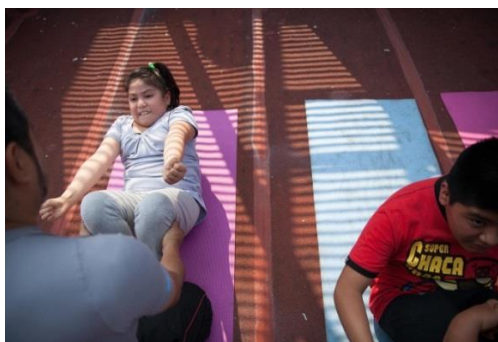
Slika 10 Pretila devetogodišnja djevojčica pri izvođenju tjelesne aktivnosti

Većinu djece koja je pretila, potrebno je poticati u održavanju vlastite tjelesne težine, tako da je izrastu, rastom u visinu. Nikako ih ne treba stavljati na redukcijsku dijetu bez medicinskog nadzora, jer se može ugroziti djetetov rast. U dobi od prve do pete godine starosti uz dijetetski pristup potrebno je poticati tjelesnu aktivnost djeteta primjerenu mogućnostima. Naglasak je na vježbanju, a ne na dijeti (Bralić, I., 2014.).