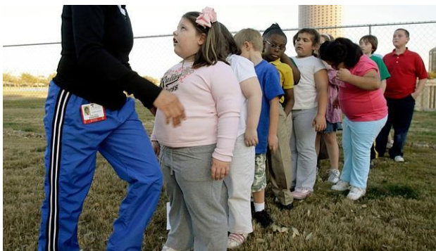
Slika 3 Grupa pretile djece

Neadekvatna prehrana i tjelesna aktivnost te uzrokujući unos energije veći od potrošnje, najvažniji su čimbenici rizika od epidemije modernoga doba - pretilosti. Suvremeno se društvo suočava sa sve većim javnozdravstvenim problemom rastućeg broja pretilih osoba svih dobnih skupina, a osobito zabrinjava trend povećanja broja pretile djece. Osobito je važno praćenje prehrane i stanja uhranjenosti djece i mladeži, jer su te ugrožene skupine u razdoblju najbržeg rasta i razvoja, pa su ujedno i dobar pokazatelj prehrambenog stanja u lokalnoj zajednici. Nepravilna i nedostatna prehrana može značajno utjecati na rast i razvoj djece i mladeži, te privremeno ili čak trajno ugroziti njihovo zdravstveno stanje (Antonić-Degač, K., 2004.)