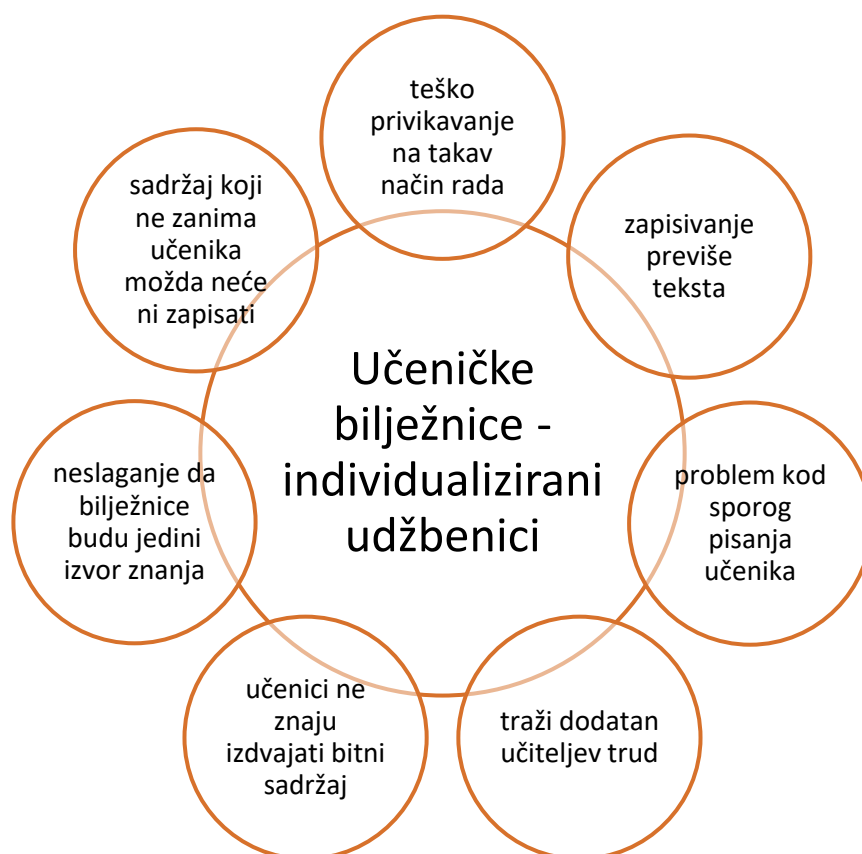
Graf 2. Mišljenje učiteljica o učeničkim bilježnicama koji služe kao udžbenici

U grafu su mišljenja učiteljica o učenikovo samostalnoj izradi bilježnica koje služe kao udžbenik.