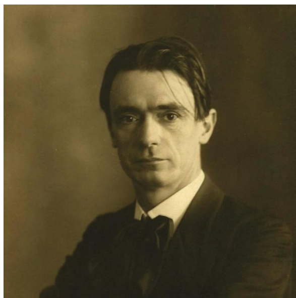
Slika 1. Rudolf Steiner