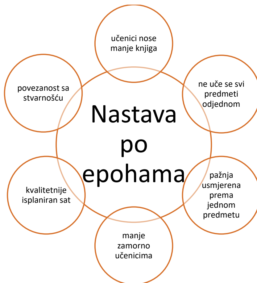
Graf 2. Mišljenje Učiteljice2 o nastavi po epohama

Učiteljica3 kaže kako se u novoj reformi pokušava postići slična struktura, tako da se povezuju sadržaji te što više međupredmetno korelira. Nije zadovoljna takvim radom jer smatra kako se prelazi iz cjeline u drugu cjelinu. (Naši to pokušavaju kroz reformu, rade na povezivanju sadržaja da se što više međupredmetno korelira. Meni se to osobno ne sviđa jer sam vidjela kako to funkcionira na „Školi na trećem“. Skače se iz cjeline u drugu cjelinu, samo da se zadovolji nekakva forma, povezivanje tema., Učiteljica1)