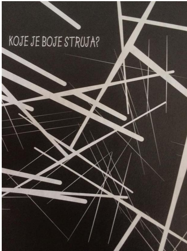
Slika 4. Zadatak „Koje je boje struja?“ iz bojanke Oboji svijet (Balić Šimrak i Šimrak, 2011)

Bojanka obiluje igrama za poticanje i razvijanje kreativnog mišljenja, a za cilj i svrhu ima potaknuti djecu da kroz igru, pokrete, likovno stvaralaštvo, glazbu izraze što više ideja i mogućih rješenja nekog problema. Za postignuće navedenog cilja od velike je važnosti omogućiti djeci pogodnu okolinu za nastajanje velikog broja ideja. Vrlo je važno da djeca steknu povjerenje u odgojitelja i da ih on motivira tako da im daje do znanja da nema pogrešnih ni smiješnih odgovora.