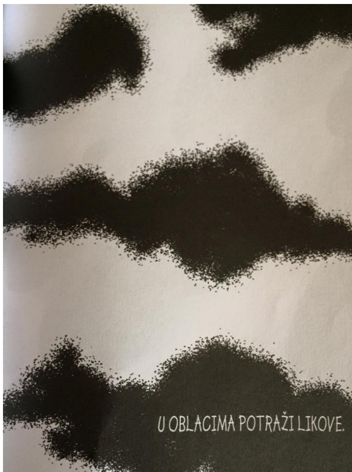
Slika 3. Zadatak „U oblacima potraži likove.“ iz bojanke Oboji svijet (Balić Šimrak i Šimrak, 2011)

Također, zadaci u bojanici izlaze iz okvira svakodnevnog, pa, primjerice, postavljaju pitanja koja zahtijevaju veću razinu mašte i inovativnosti, kao, na primjer, pitanje o tome koje je boje struja (Slika 4).