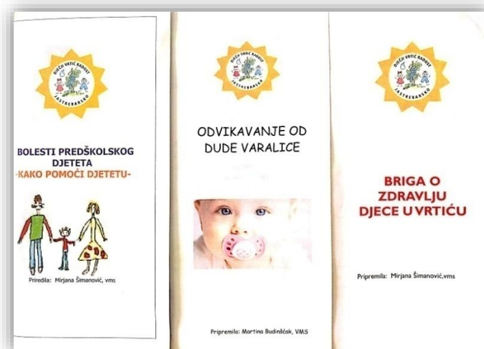
Slika 1. Primjer informiranja i motiviranja roditelja putem letaka u Dječjem vrtiću "Radost", Jastrebarsko

Letak „Bolesti predškolskog djeteta – kako pomoći djetetu“ (Slika 1) pruža informacije kako prepoznati znakove bolesti i na koji način roditelj može najbolje pomoći svojem djetetu. Letak „Odvikavanje od duche varalice“ informira o dobrim i lošim stranama korištenja duche, kako održavati i koristiti duche te daje savjete na koji način odviknuti dijete od duche. Naposljetku, letak „Briga o zdravlju djece u vrtiću“ kaže da je jedno od temeljnih dječjih prava - pravo na zdravlje te na koji se način provodi zdravstvena zaštita u vrtiću, koji su najčešći zdravstveni problemi djece i kako pomoći bolesnom djetetu.