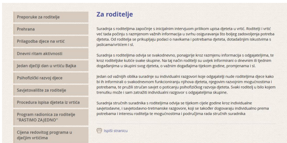
Slika 2. Primjer kutka za roditelje na web stranici dječjeg vrtića "Bajka"

kutak za roditelje na njihovoj web stranici 6 .