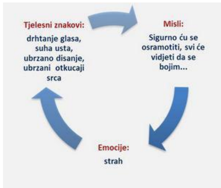
Slika 1. Grafički prikaz kognitivno bihevioralnog modela ispitne anksioznosti

Wine (1971, prema Juretić, 2008) je prilikom brojnih istraživanja došla do zaključka kako studenti koji prilikom ispitne situacije osjećaju anksioznost doživljavaju smanjeno postignuće upravo zbog misli koje se rezultiraju brigom tijekom ispitne situacije. Kod rješavanja ispitnih pitanja Wine smatra kako je pažnja studenta preusmjerena sa zadatka zbog pojavljivanja ometajućih misli zabrinutosti.