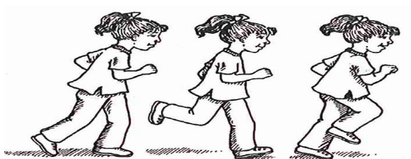
Slika 1. Ilustracija Dale A. Ulrich: Test of gross motor development

Izvor: Ulrich, A. D.(2000). Test of gross motor development [Digital image]. Preuzeto s http://33202576.weebly.com/uploads/1/4/6/8/14680198/tgmd-2-2.pdf (13.07.2019.)