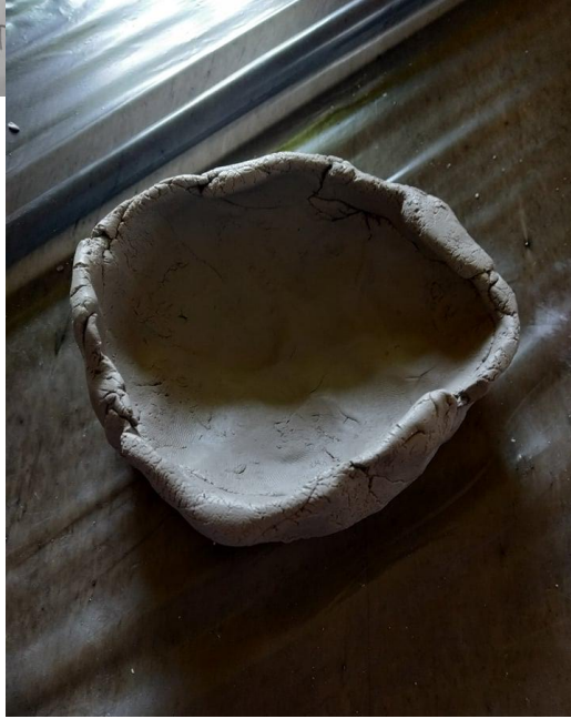
Slika broj 6 – Martin, 6 godina „Rimska zdjela“

Kod dječaka Martina od samog početka primjećujemo okupiranost lončarskih predmeta i kipova nimfe, što je vidljivo u modeliranju zdjele bez izražavanja kreativnosti i potrebe za izražavanjem kreativnosti ukrašavanjem. Nadalje, u baratanju olovkom osjeća se sigurnije i motiviranije, te smisao za detalje pokazuje uresima na zdjeli, a sam sebi dodatno zadaje motiv „Tri nimfe“. Iako je njegova zainteresiranost eskalirala tek pri samom kraju aktivnosti, dječak Martin pokazao je izrazitu individualnost pri odabiru motiva (zdjele, nimfe) u odnosu na ostale dječake koji su odabrali isti motiv (Rimske iskopine).