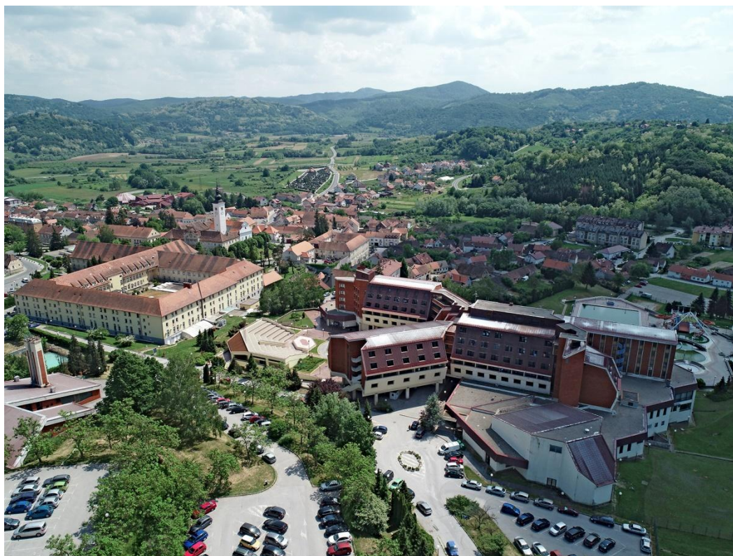
Slika 1.1. Specijalna bolnica za medicinsku rehabilitaciju Varaždinske Toplice

U slikovitom krajoliku na sjeveroistočnom rubu Hrvatskog zagorja, u zaklonu Topličke gore i kotlini rijeke Bednje, na sedrenim barijerama prostire se grada Varaždinske Toplice. Područje grada obuhvaća površinu od 79,75 km 2 u 23 naselja koja zajedno broje 6364 stanovnika što grad smješta u ispod prosječnu naseljena mjesta u Varaždinskoj županiji. Osim prirodnih ljepota i umjereno blage klime, jedna od blagodati ovog kraja je izvor ljekovite termalne vode čiji je potencijal prepoznat još u rimsko doba te je služio kao temelj za gradnju terma i čitavog naselja Aquae Iasae, a ostaci ovog lječilišno-kupališnog kompleksa smatraju se jednim od najznačajnijih arheoloških nalazišta u Hrvatskoj. Danas su Varaždinske Toplice moderno lječilište koje datira još iz davne 1838. godine, sadrže tri veća hotela („Terme“, „Minerva“, „Bernarda“) te lječilišne objekte „Konstantinov dom“ i „Lovrinu kupelj“, a povijesna medicinska važnost grada očituje se kroz djelatnost Specijalne bolnice za medicinsku rehabilitaciju Varaždinske Toplice (Slika 1.1.) (Ivanišević,2013).