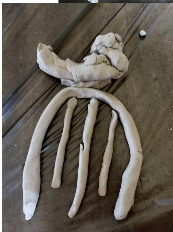
Slika broj 2 – Klara, 6 godina