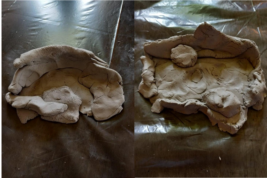
Slika broj 7- Martin, 7 godina Slika broj 8 – Gabrijel, 7 godina

Kroz razgovor za vrijeme likovne aktivnosti dječaci ističu da žive u istoj zgradi, te da svoje slobodno vrijeme zajedno sa roditeljima provode u parku igrajući se oko Rimskih iskopina. Na temelju toga možemo zaključiti zbog čega su upravo taj motiv uzeli kao glavni motiv za modeliranje. Bez razmišljanja i oslanjanja na fotografije, samouvjereni su pristupili modeliranju. U odnosu na djevojčice manje pažnje posvećuju detaljima, a više ih impresionira sama rimska arhitektura i struktura.