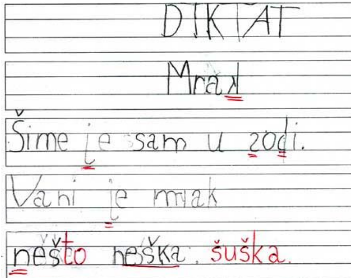
Slika 2: Zrcalno okretanje slova u diktatu

utječe na nemogućnost učenja ispravnog oblika riječi. Otežano čitanje i zastoji u čitanju nastaju ako se djetetu slova okrenu ili umjesto riječi vidi prazno polje.