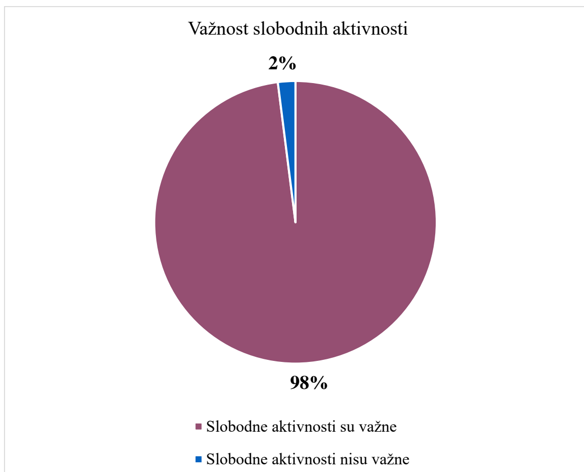
Grafikon 4. Važnost slobodnih aktivnosti

Od 47 ispitanih, samo dvoje roditelja smatra da slobodna aktivnost nije važna. Ostali se slažu da one „pogoduju motoričkom, socijalnom i psihofizičkom razvoju, cjelokupnom zdravlju, usvajanju novih vještina, razvijanju percepcije, učenju poštivanja pravila, stvaranju prijateljstva, komunikaciji i suradnji, sudjelovanju u timskom radu, razvijanju samostalnosti i samopouzdanja, preuzimanju odgovornosti za sebe i svoja djela; da djetetu treba omogućiti da ispituje svoje granice, dopustiti mu da se igra ali ne forsirati ga“. Roditelji koji su odgovorili negativno na to pitanje kao razlog navode da „aktivnost nije nužna potreba za dijete. Ako pokaže interes naravno da ga treba u tome podržati, ali ako ne, da ga ne treba forsirati. Tijekom školovanja imat će ih i previše. Predškolska djeca bi trebala imati dovoljno vremena za igranje i druženje s najbližima“.