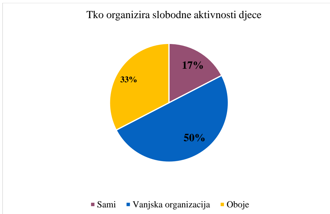
Grafikon 1. Raspodjela izvora organizacije slobodnih aktivnosti djece

Iz grafikona br. 1 može se zaključiti da se roditelji više oslanjaju na različite odgojno obrazovne ustanove kada je u pitanju organiziranje slobodnih aktivnosti njihove djece (50%). Te organizacije uključuju: radionice gradskih knjižnica, glazbene i likovne radionice, škole stranih jezika, te razne sportske škole. Najveći postotak roditelja, njih 33%, izjasnilo se da kombiniraju organiziranje aktivnosti koje su sami organizirali i aktivnosti organizirane od strane različitih odgojno obrazovnih ustanova. Najmanji postotak, njih 17%, samostalno organizira aktivnosti – odlasci u park, kazališta, kina.