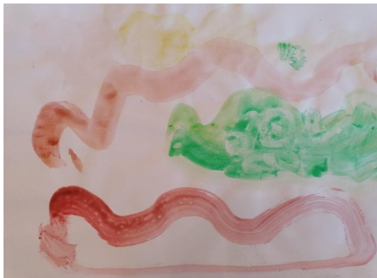
Slika 11. „Voda“ (5 godina, Ž)

Slika 11. rad je djevojčice koja je tehnikom akvarela prikazala svoj strah od vode na papiru A4. Na radu je zapravo prikazano more smeđom, zelenom i žutom bojom što i kod ovog rada upućuje da je odabir boje subjektivnog karaktera. Valovitim i kružnim linijama djevojčica prikazuje gibanje valova.