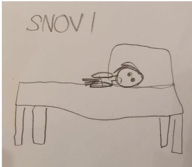
Slika8. „Snovi“ (7 godina, Ž)

„Neke noći loše sanjam, bojim se i ne mogu se probuditi.“ „Kad sanjam duha“ likovni je rad djevojčice koja je na papiru A4 bojicom prikazala sebe kako sanja. Lik djevojčice prikazan je kao „punoglavac“, laganim potezom bojice i centriran je u sredini. svojim crtežom šalje poruku da se osjeća malo i bespomoćno u trenutku suočavanja sa snovima u kojima sanja duha.