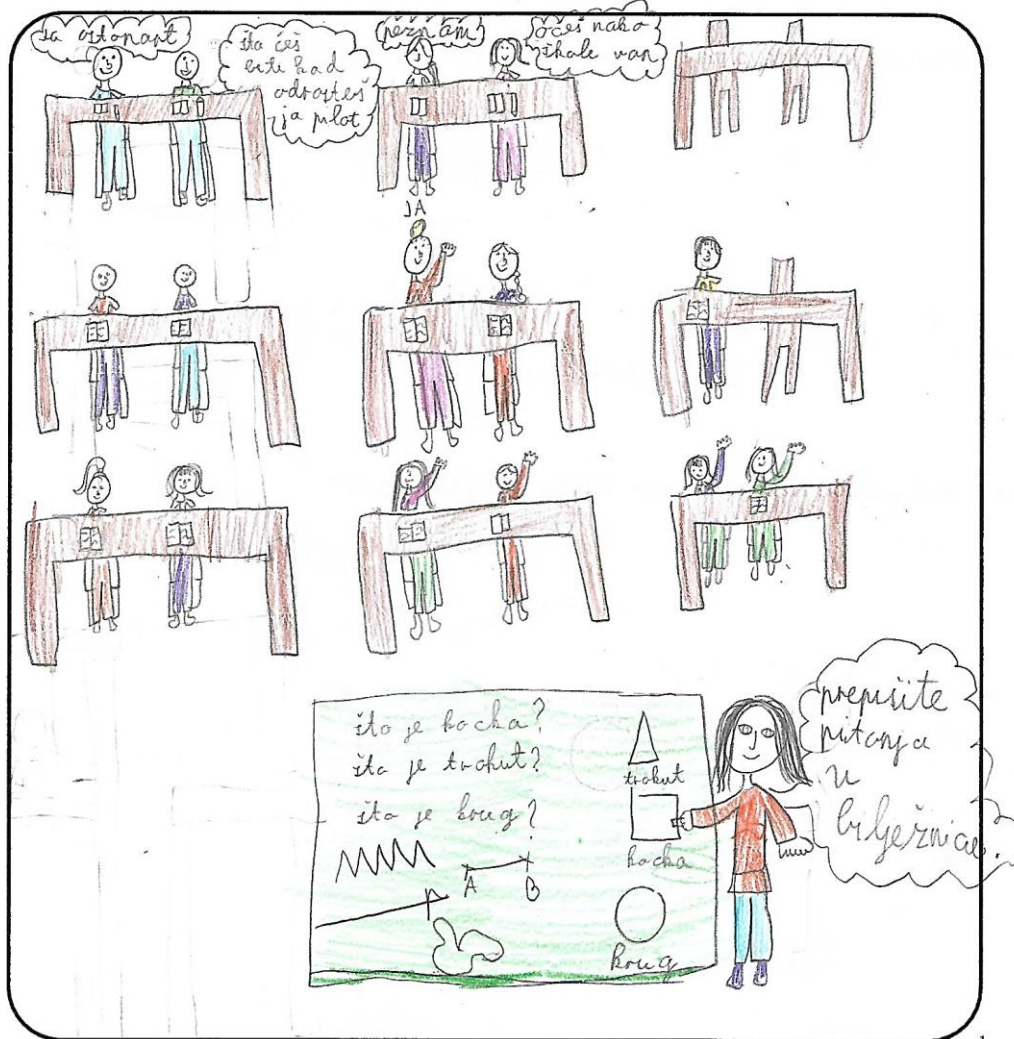
Slika 2. Učnički prikaz tipičnog sata geometrije u 3. razredu