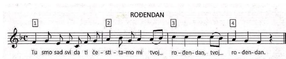
Slika 5: Pjesma "Rođendan" (Kraljić, 2017.)