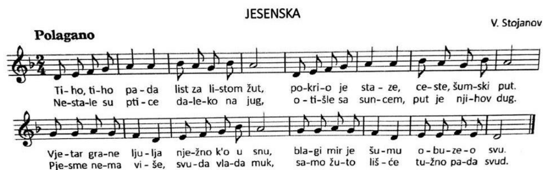
Slika 4: "Jesenska" pjesma (Kraljić, 2017.)