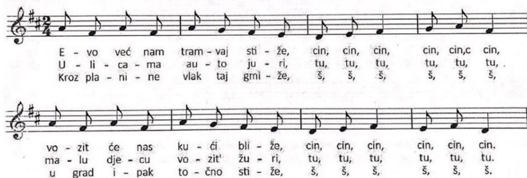
Slika 13: Pjesma "Tramvaj, auto, vlak" (Kraljić, 2017.)