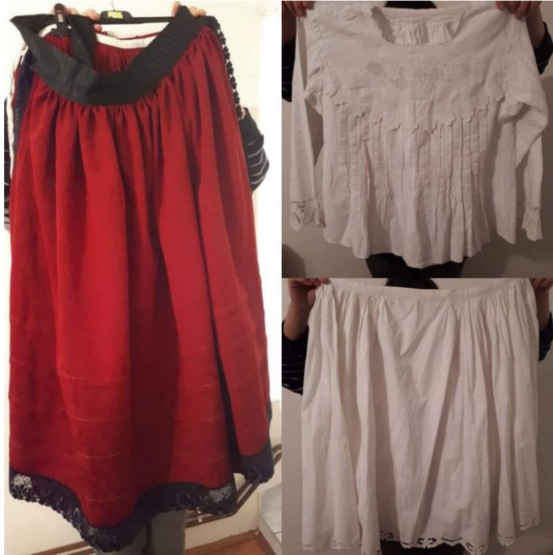
Slika 3. Dijelovi narodne nošnje iz Suhopolja

Za narodnu nošnju iz Suhopolja (slika 3) djeca su najprije rekla da se sastoji od: