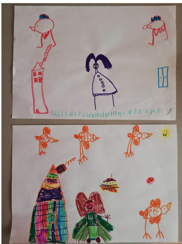
Slika 8. Dječji crteži potaknuti podravskim riječima i govorom (privatni arhiv)

Zanimljivi su crteži lastavica i narodne nošnje te komentari djece koja su ih nacrtala, a koji će biti prikazani u nastavku.