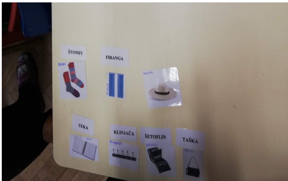
Slika 2. Igra pamćenja i uparivanja riječi sa slikom

„To su smiješne riječi i jezik se pleće kod izgovaranja.“