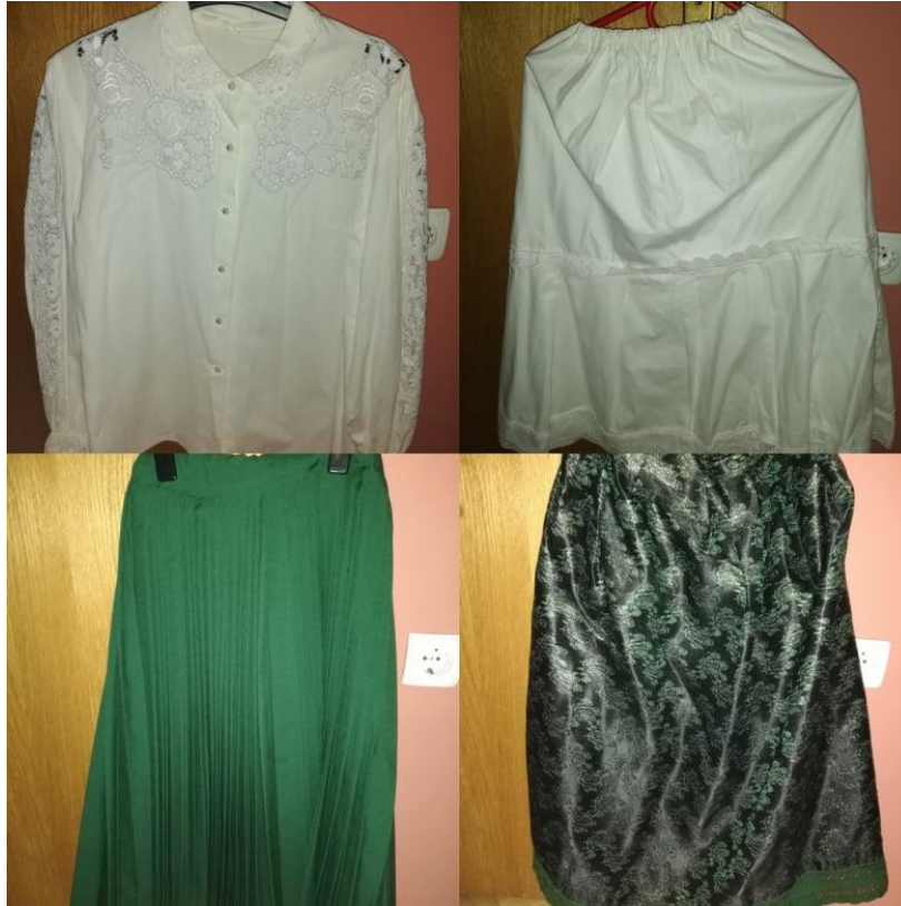
Slika 5. Dijelovi narodne nošnje iz Gole

Djeca su za narodnu nošnju iz Gole (slika 5) govorila: