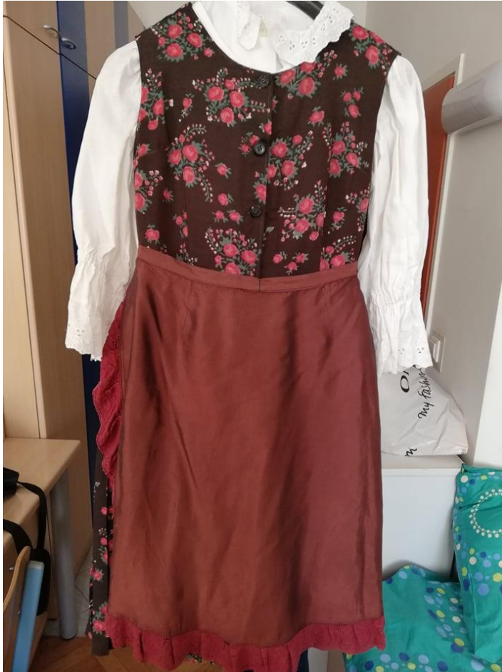
Slika 4. Narodna nošnja iz Petrijanca.

Djeca su rekla da se narodna nošnja iz Petrijanca (slika 4) sastoji od: