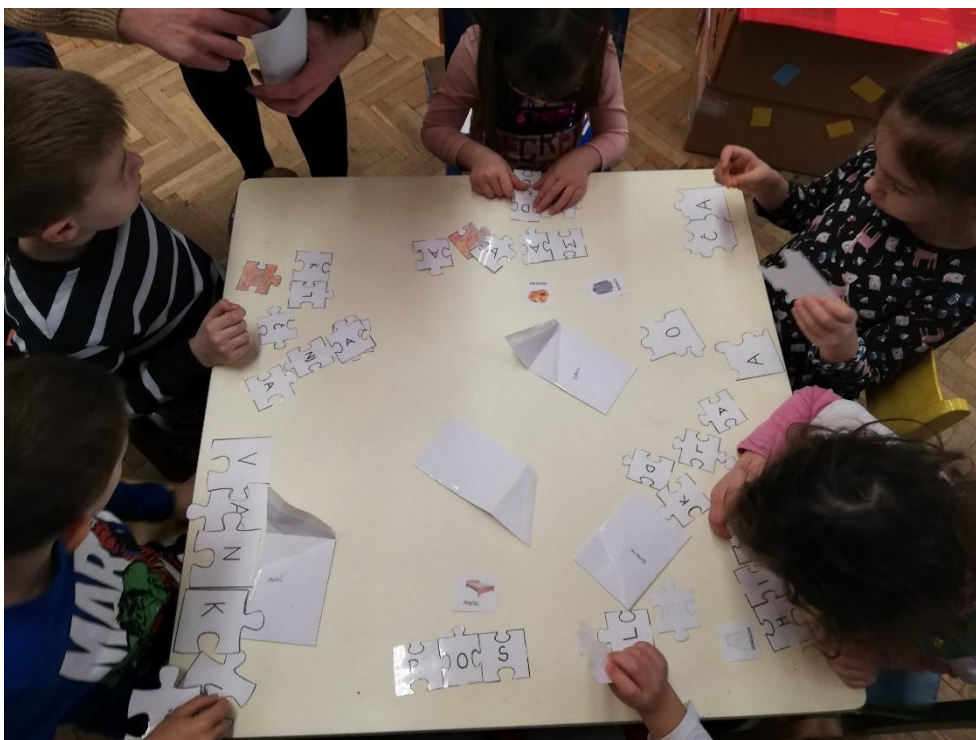
Slika 1. Slaganje riječi podravskog dijalekta

Četvrti su dan u vrtiću pripremljene dvije narodne nošnje – u Virovitici su to bile narodna nošnja podravskoga kraja (Gola) te narodna nošnja slavonskoga kraja (Suhopolje), dok je u Varaždinu uz podravsku narodnu nošnju pripremljena narodna nošnja varaždinskoga kraja (Petrijanec). Elementi pojedine narodne nošnje su se imenovali te međusobno uspoređivali.