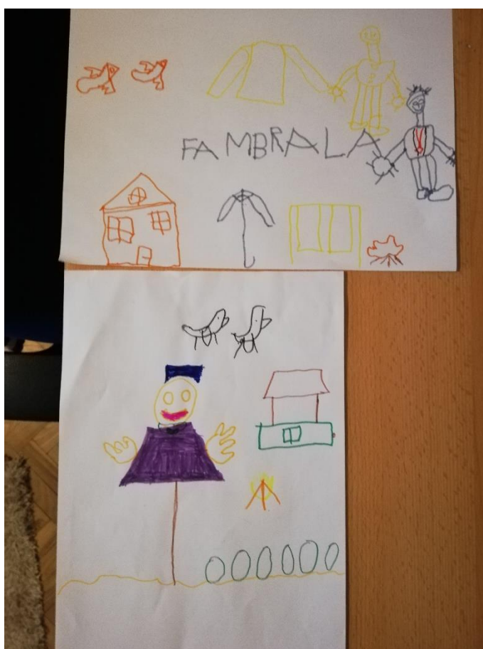
Slika 7. Dječji crteži potaknuti podravskim riječima i govorom (privatni arhiv)

Drugi crtež (slika 6) prikazuje: „mene u narodnoj nošnji iz Podravine gdje se kaže kaj, lastavice koje su došle u kuću i ambralu i kredenc kamo ide robača. A tu je i ljuljačka. Ne! Hindalka.“