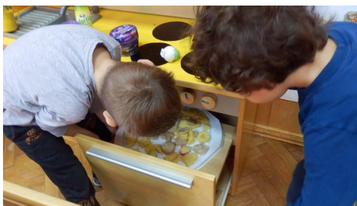
Slika 3. Pečenje kolača

Senzornu kutiju su proučavali, gledanjem, dodirivanjem i osluškivanjem, a u jednom trenutku su u nju počeli stavljati figurice i izvoditi svoju predstavu.