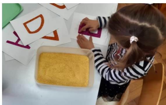
Slika 8. Centar početnog čitanja i pisanja