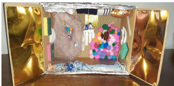
Slika 4. Senzorna kutija 1

Senzornu kutiju su proučavali, gledanjem, dodirivanjem i osluškivanjem, a u jednom trenutku su u nju počeli stavljati figurice i izvoditi svoju predstavu.