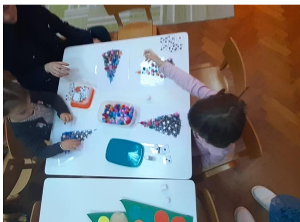
Slika 7. Matematički centar