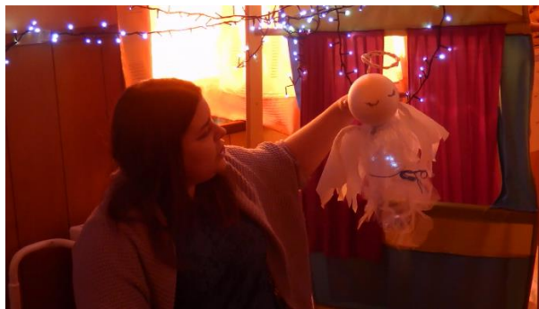
Slika 1. Pripovijedanje

Promatrač – prati sve aktivnosti, način na koji djeca sudjeluju, izjave i pitanja