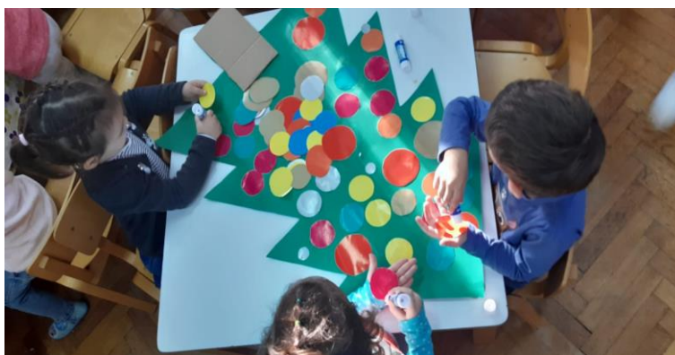
Slika 9. Likovni centar

Aktivnosti koje su imale taktilnu komponentu djeci u ovoj skupini bila su zastupljenija, što je i logično prema razinama senzorne integracije. Pažnja za vrijeme pripovijedanja bila je usmjerena na pripovjedača te su bili u stanju iščekivanja što će se sljedeće pojaviti u priči i zapamtili su redom fabulu.