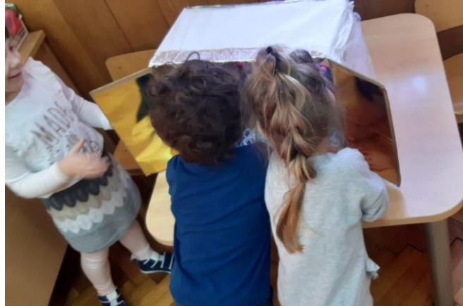
Slika 5. Senzorna kutija 2

Djevojčica koja se inače navezivala na prisutne studentice i dječak koji je samo bio nervozan igrali su memori s kolegicom koja je bila u sobi. Djevojčica je sudjelovala i u ostalim aktivnostima, dok je dječak pristupio samo plastelinu tek kada sam započela s pripovijedanjem. Primijetila sam da sluša priču dok mijesi plastelin.