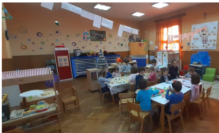
Slika 2. Aktivnosti prije pripovijedanja