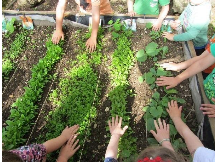
Slika 1. Djeca sade biljke u vrtićkom vrtu