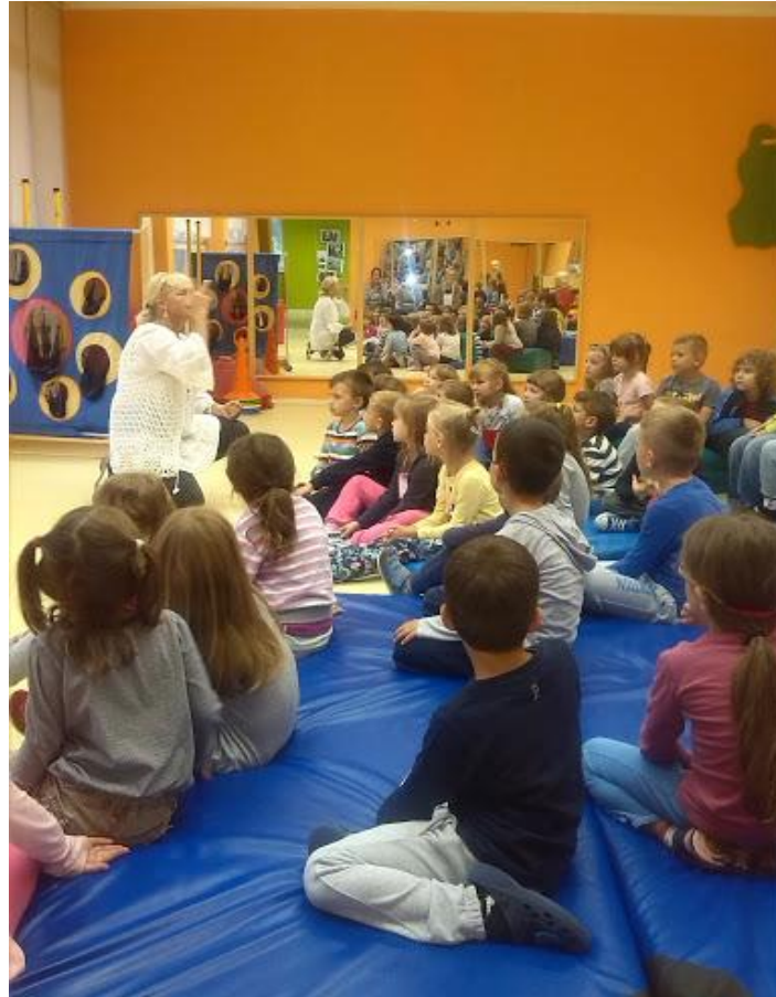
Slika 7. Djeca iz Dječjeg vrtića En ten tini u Gradu mladih (komunikacijska soba)