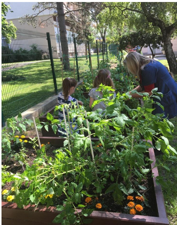
Slika 2. Djeca uz odgojiteljicu istražuju promjene na biljkama u Dječjem vrtiću Maksimir