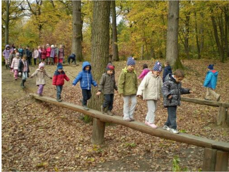
Slika 8. Djeca iz dječjeg vrtića Siget u Gradu mladih (sportske aktivnosti na otvorenom)