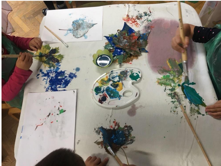
Slika 3. Djeca bojaju lišće vodenim bojama i preslikavaju na platno

plakatu zanimljivu kompoziciju ili tvorevinu. Pritom im možemo ponuditi komadiće kore drveta različitih boja, koru naranče ili limuna, kikiriki, češer ili što drugo iz prirode. Pozivajući se na odgoj i obrazovanje u duhu suvremenoga kurikulumu, kvalitetnim oblikovanjem okruženja potičemo dijete na interakciju s prostorom i materijalima stavljajući naglasak na njegov istraživački potencijal. Tako mu omogućujemo da organizira svoje aktivnosti i surađuje s drugom djecom i odgajateljem, ali i da stječe i razvija različite kompetencije. 5