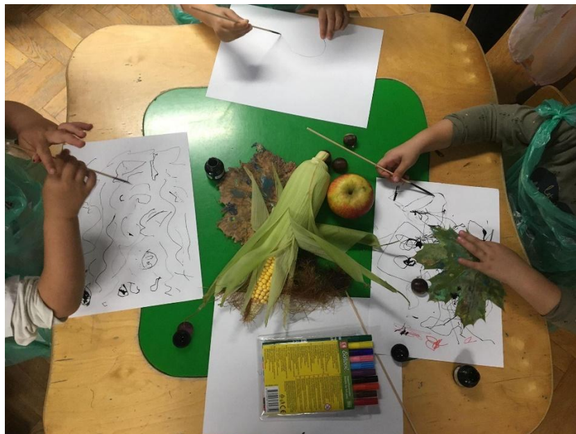
Slika 5. Djeca tehnikom tuša preslikavaju ponuđene jesenske plodove iz prirode