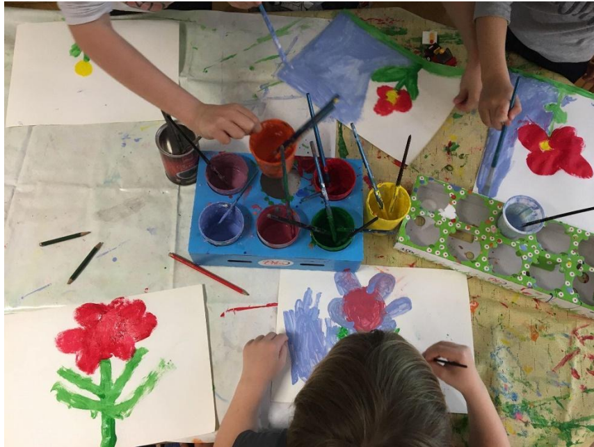
Slika 4. Djeca vodenim bojama slikaju cvijeće

Detalji iz prirode mogu poslužiti kao predložak za likovno izražavanje s različitim materijalima. Međutim, tek djeca koja pred sobom vide, istražuju, uočavaju različitost cvjetova ili drugih biljaka, bit će u stanju tu različitost prenijeti i u svoje radove. Na taj način crtež će biti rezultat djetetova doživljaja prirode, a ne tek shematski prikaz.